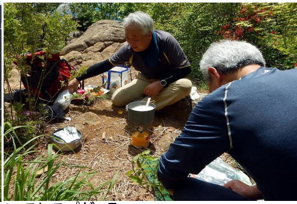
各自手持ちのパスタソースにスパゲッティ