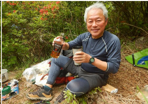
炭酸割りのウイスキー、ローソン100円氷がグイグイ喉をうるおし過ぎます