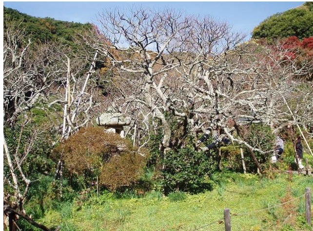
なだらかな坂道、ハイキングーツ！