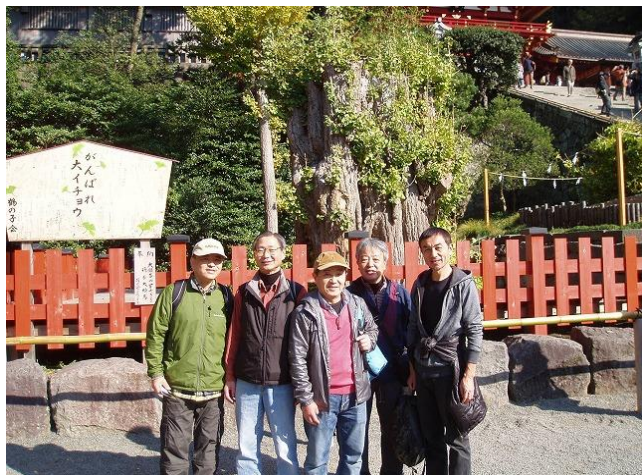
鎌倉時代：源頼朝、北条時宗歴史散歩