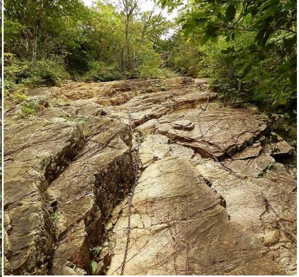
クサリに手をかけ足場を固め一步一步よじ登っていきます。