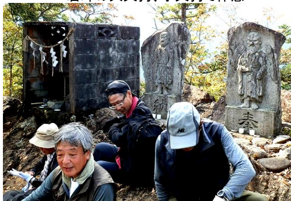
岩峰の大天狗、子天狗で休憩