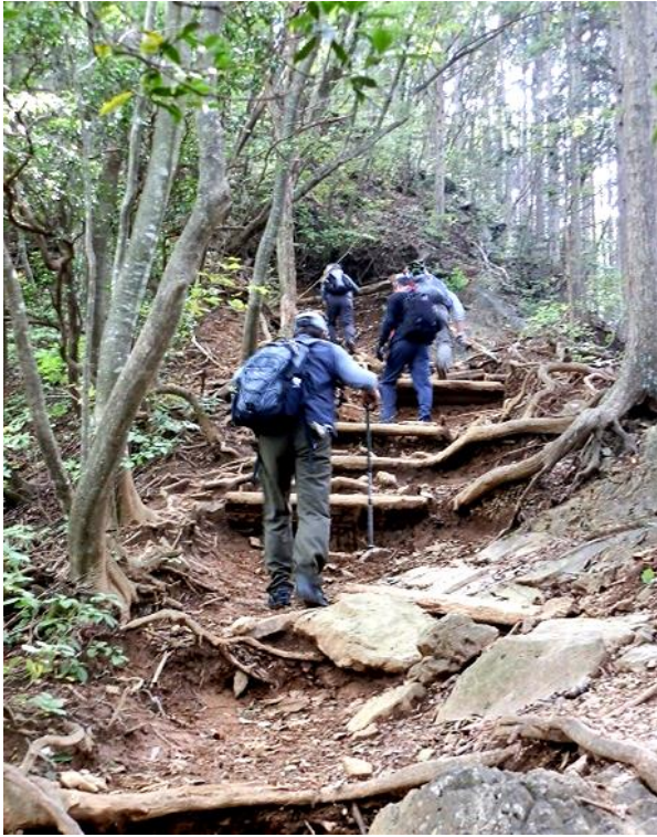
鋸山～めざすは大岳山、御岳山へ