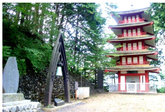
知恵絞らず、汗絞ってます。