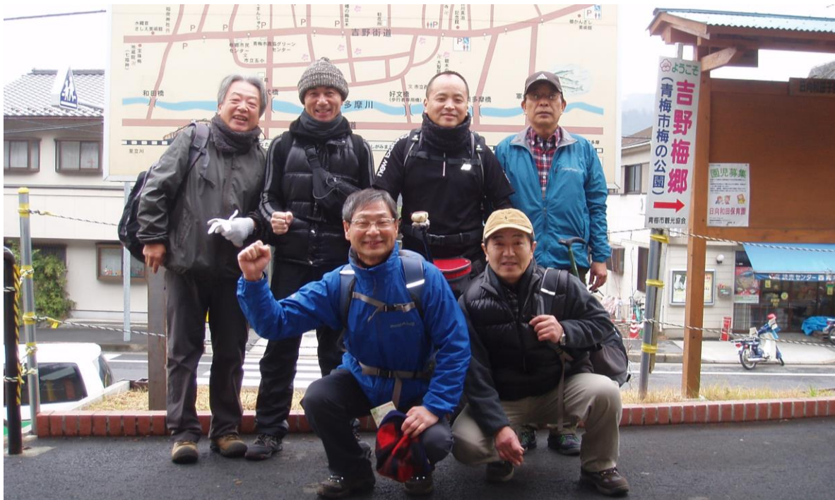
日の出山登山口にて、いざしゅっぱ〜つ