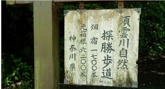
須雲川自然探勝歩道、元箱根まで6.2km