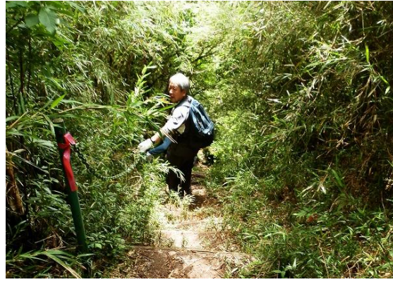
関所を破ってこの山道に逃れたものもあった