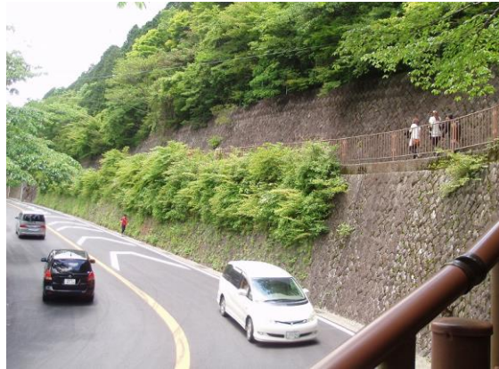
甘酒茶屋(峠)にて、甘酒をいただきました。