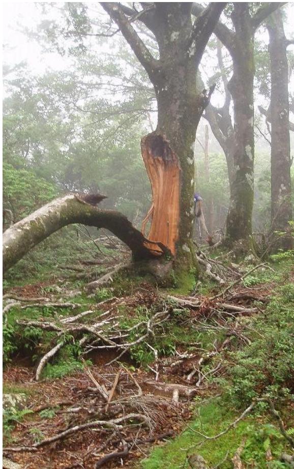
木の隙間に雪が積もり凍ると割けて折れた