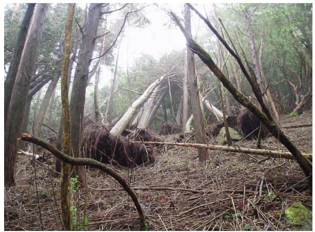
天城山にはシャクナゲ、アマギツツジ、アセビ、ヒメシャラが混生 ブナノ原木『ヘビブナ』は有名