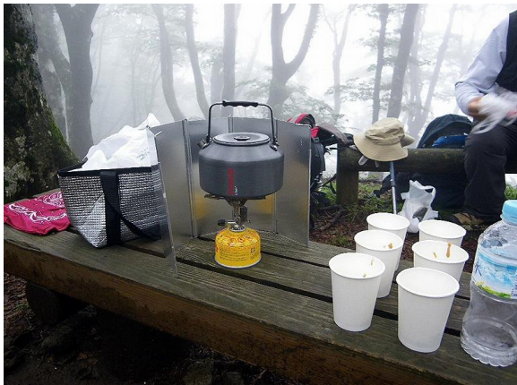
小岳で昼食、おやかん様による湯沸し