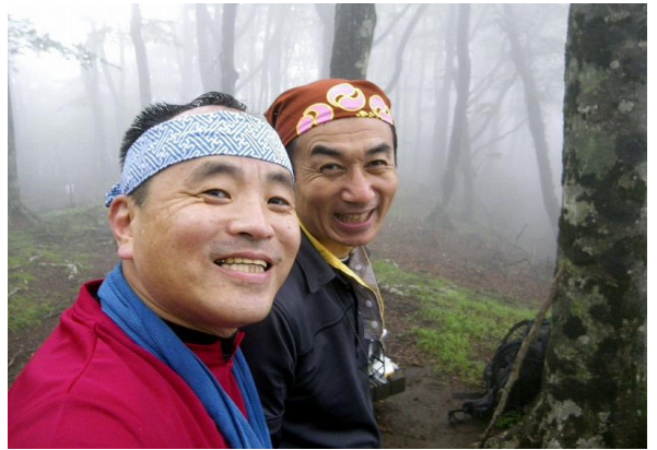
八丁池はもやで一寸先も何も見えません、今後の人生と同じもやもやでした