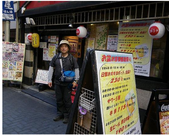
打ち上げは池袋居酒屋『清龍』でリベンジ成功の祝杯をあげました