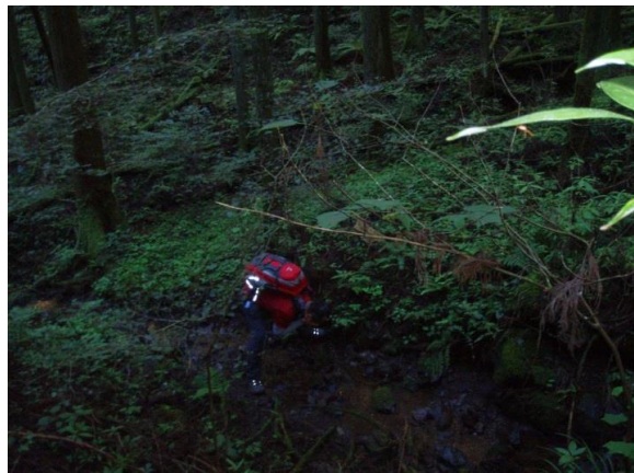
昨年負傷途中断念した古川一等兵は今年無事リベンジ果たし上等兵になりました 昨年9/23吾野駅階段を松村さんの支えでのぼる じょうとうじょうとう、じょうとうやないの