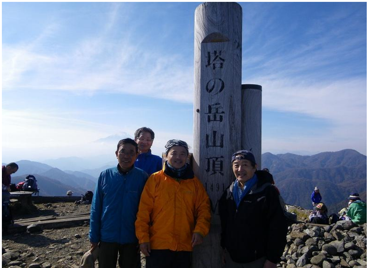
山頂は登山客で大賑わい