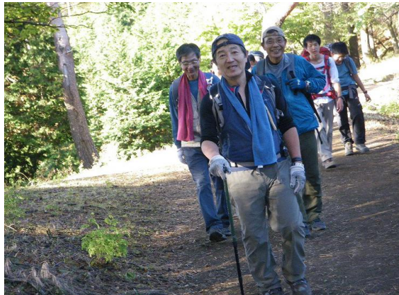
黄門様と、後ろに控える助さん角さん