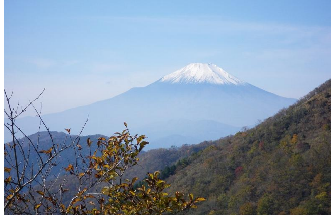
塔ノ岳山頂は青空が広がり360度パノラマ眺望