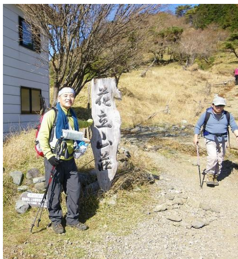
足元ふらつく人生を支える2本ポールです