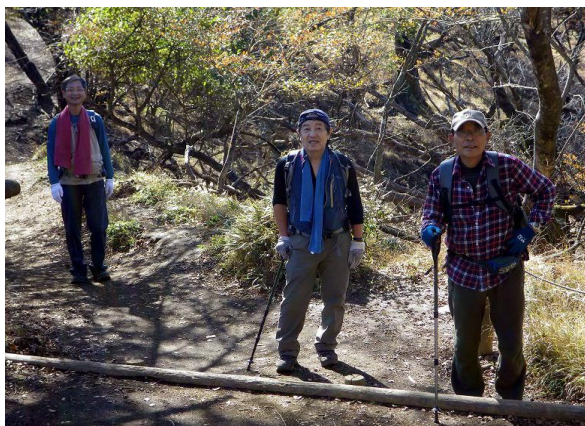
帰りの下りは膝にこたえるが、余裕の笑顔