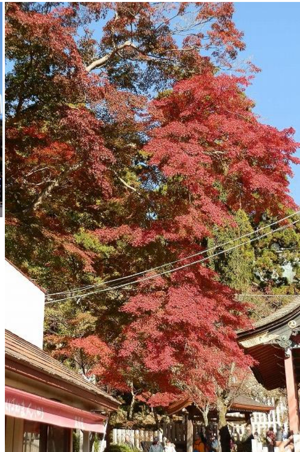
町田会若手精鋭3人が筑波神社入り口に集合、目指すは 男体山