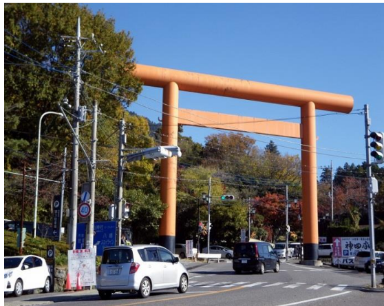
大鳥居を超え参道に入ります