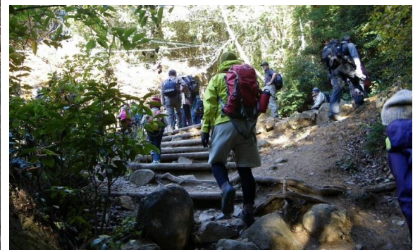
男体山頂上は360度パノラマ