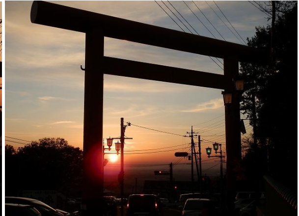
ひと夜明けたようないつもの明るさと安堵感