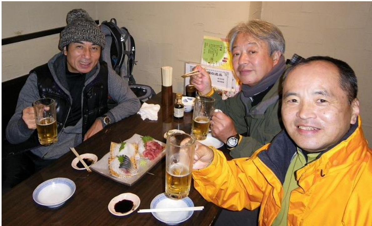
筑波山あなどるなかれ、舐めたらあかん筑波山でした