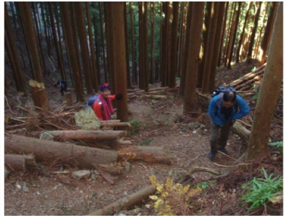
古川リーダーの綿密、緻密そして細心の計画 モットーは油断大敵、大胆不埒