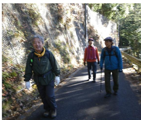
興味津々『乳房観音』 まだまだ探究心は衰えてません