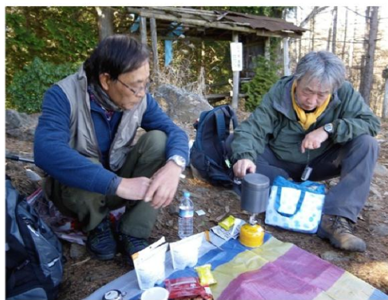
本日のメニュー:レトルトカレーの出来上がり、周辺はカレーの匂い充満、これぞ加齢臭