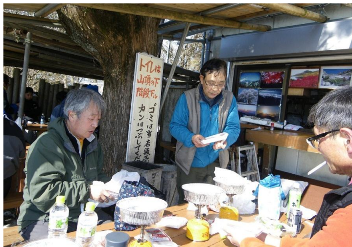
湯沸しバーナ4台フル稼働