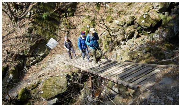
右と左、前と後方、表と裏をまちがえないよう、ここでアイゼン装着