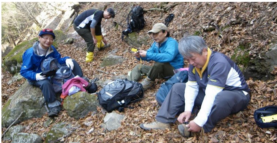
出身校も滑り止め、山歩きも我ら滑り止め人生