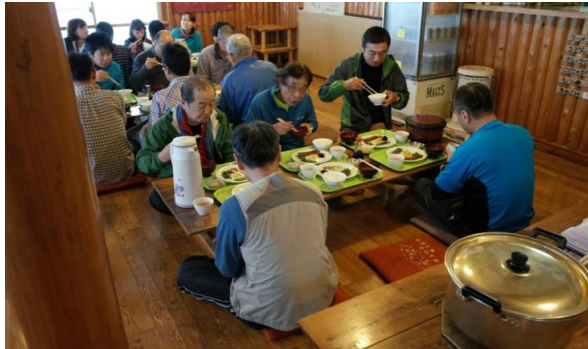
赤岳頂上山荘の夕食