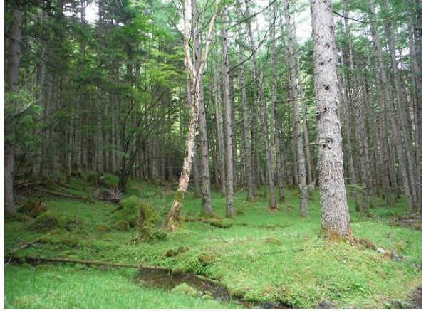
白樺林から突然にかもしかが現れました