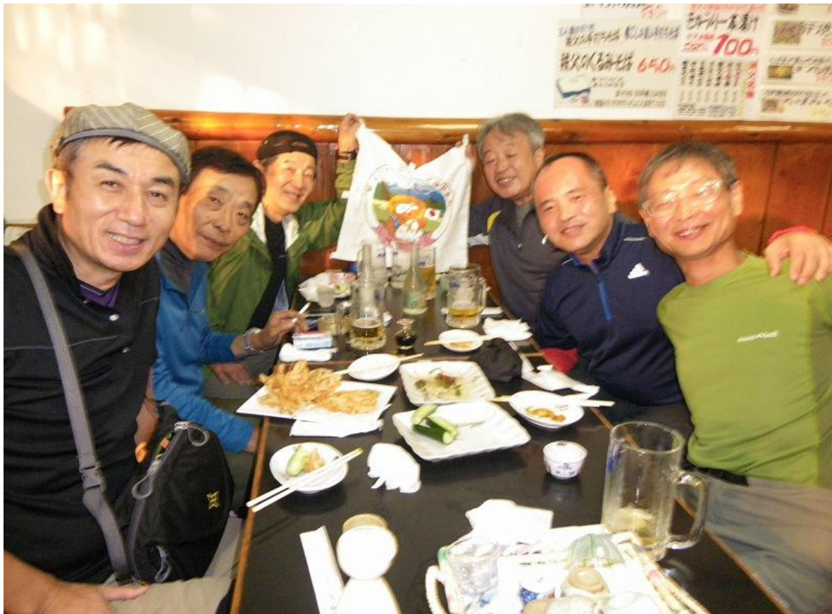
一心会の山歩きは毎回毎度、『至れりの尊』『尽くせりの尊』によって計画されてます。 次回は尾瀬(10月12日～13日)『やまとたけやすの尊』にご案内いただきます。