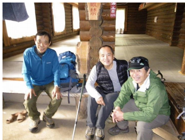
両神山頂上まで、試練の道は続きます