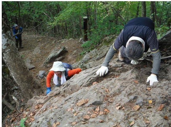
滑落事故件数→埼玉県最多のコース