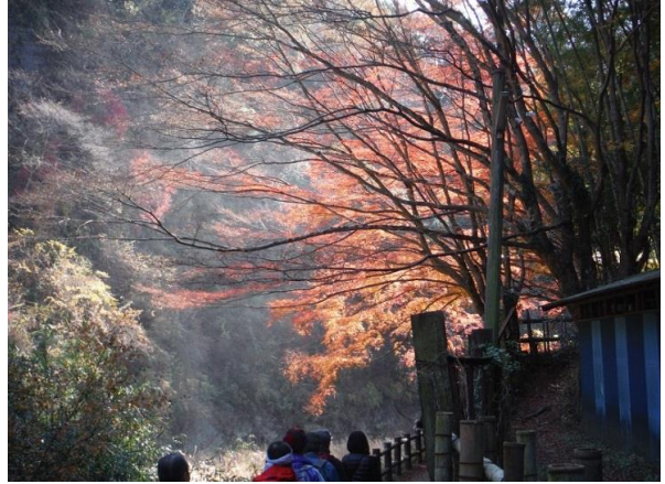
川の流れがUの字に、自然の溪谷そのもの