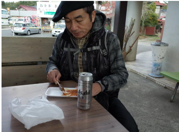
ちょっとお先にいただきます