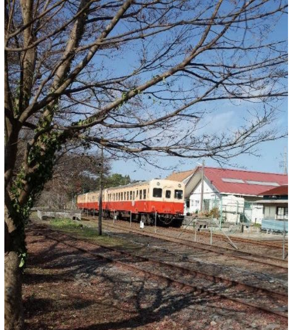
小湊鉄道(五井～上総中野)