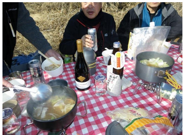
最後はふぐひれ酒、ハラホロヒレハレ、ハラホロヒレ酒