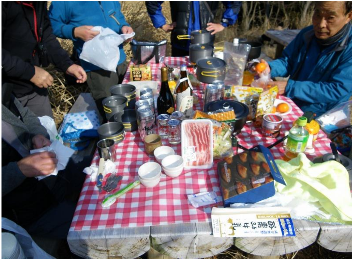
今回は餅づくし(お雑煮 焼き餅、おしるこぜんざい)→お・も・ち・あ・り