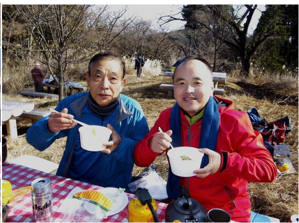
駿馬にはなれずとも駄馬であってはいらない我ら無事これ名馬なり！！