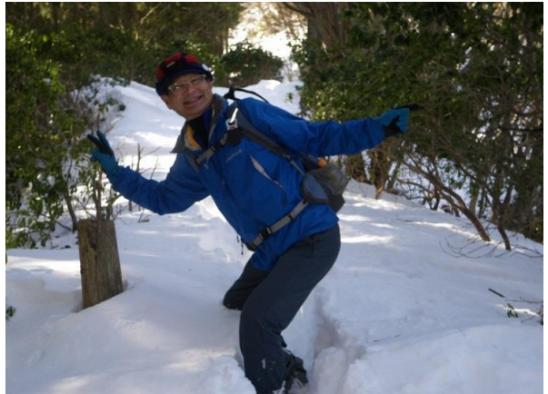
ところが、雲行き(雪)が変わり、名栗分岐でアイゼン着用