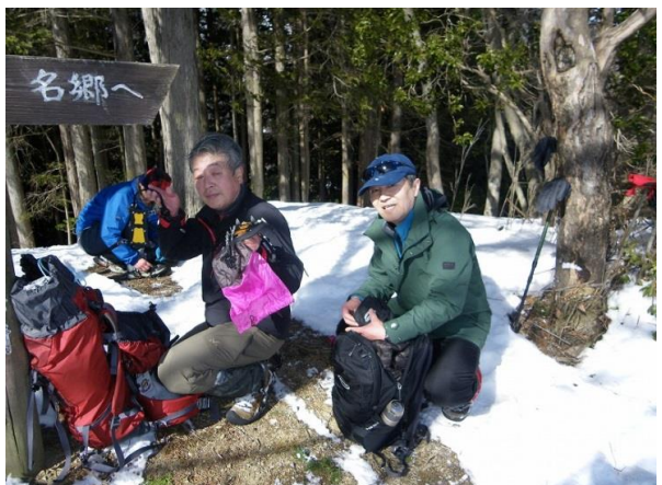
♪ゆ〜きも、こお〜りも踏〜み超えてのアイゼンの唄合唱