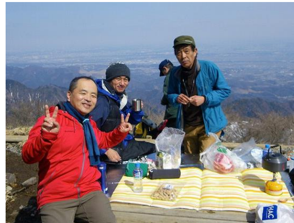
ランチに満足した隊員のにっこり笑顔です