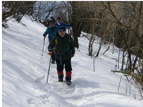
二ノ塔、三ノ塔、塔の岳 丹沢山系が美しい