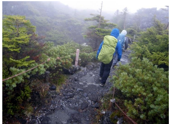
高山植物と木々、むき出しの岩