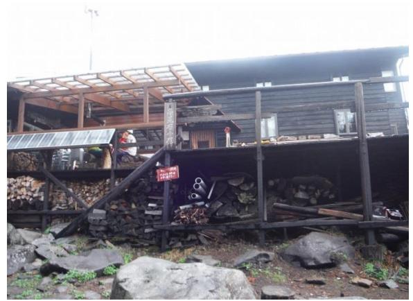
にゅう山頂にておにぎりランチ