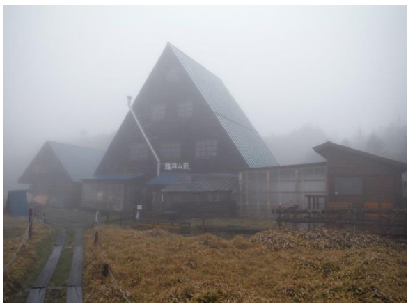
雨をしのぎ、軒先借りておにぎりランチ