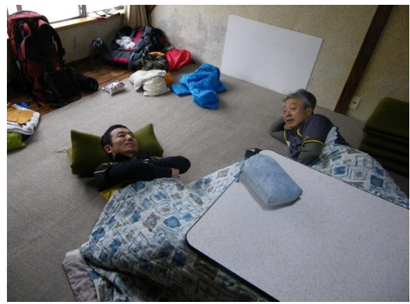
2日目寝起きもすっきり、出発6時50分