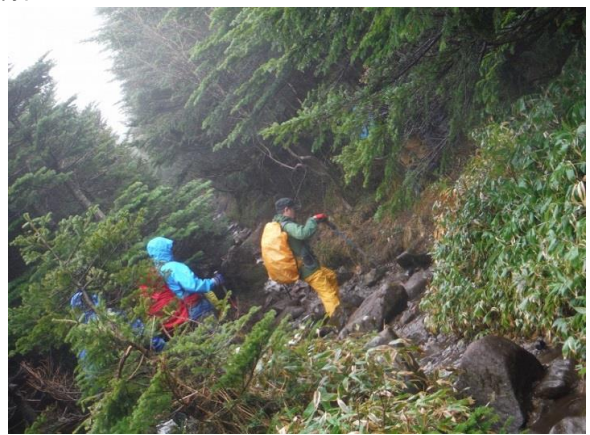
溝道を登っていくと、残雪道