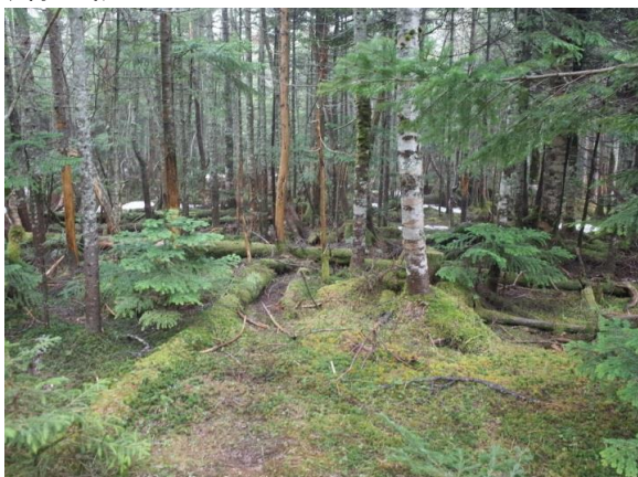
むき出しの根っこに苔がはいつくばり