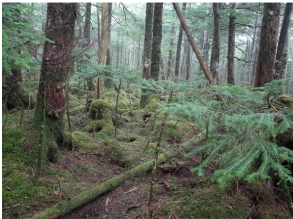
一帯の苔、緑の絨毯