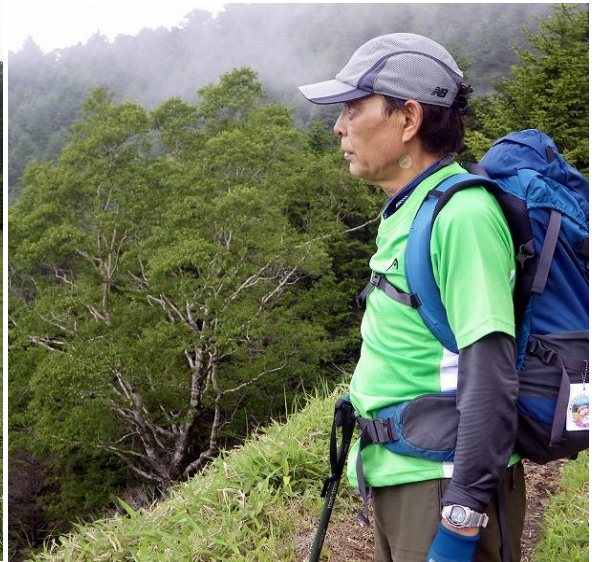
その先には新緑の木々、眼下には大菩薩湖で『どうってことはありませんでした』