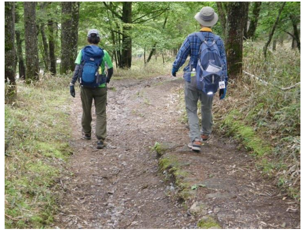
福ちゃん荘にて氷水休憩