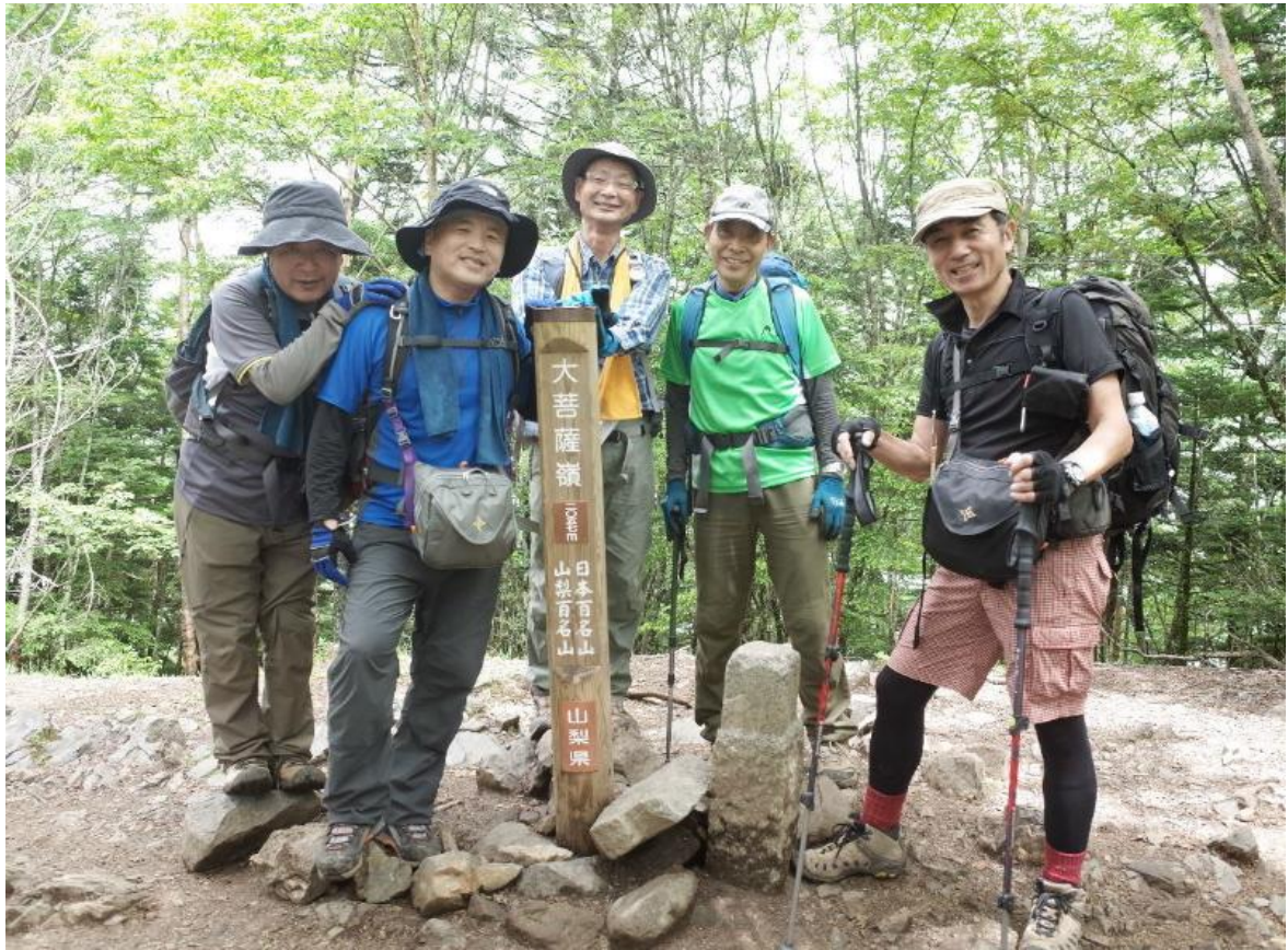
雷岩もなんのその、帰路は足取りも軽く