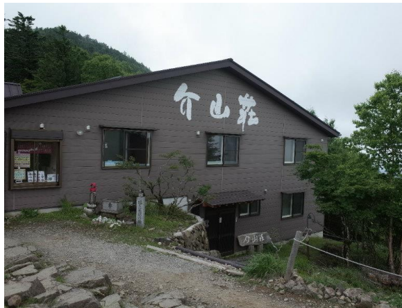
中里介山『大菩薩峠』: 介山荘