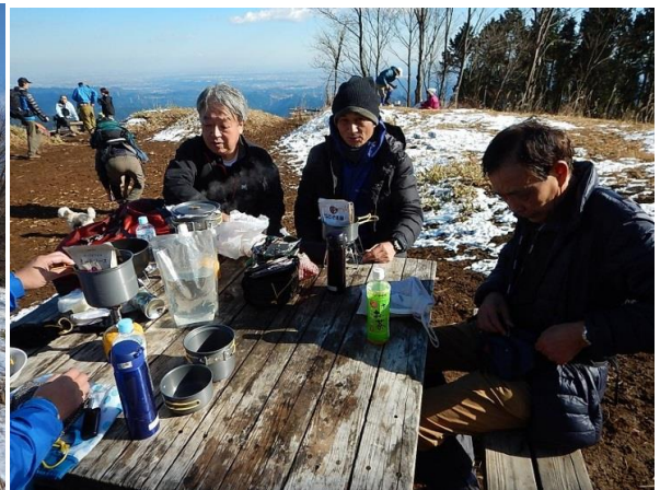
持ってきたご飯を蒸して温く、カレールーも温めおいしいカレーランチ