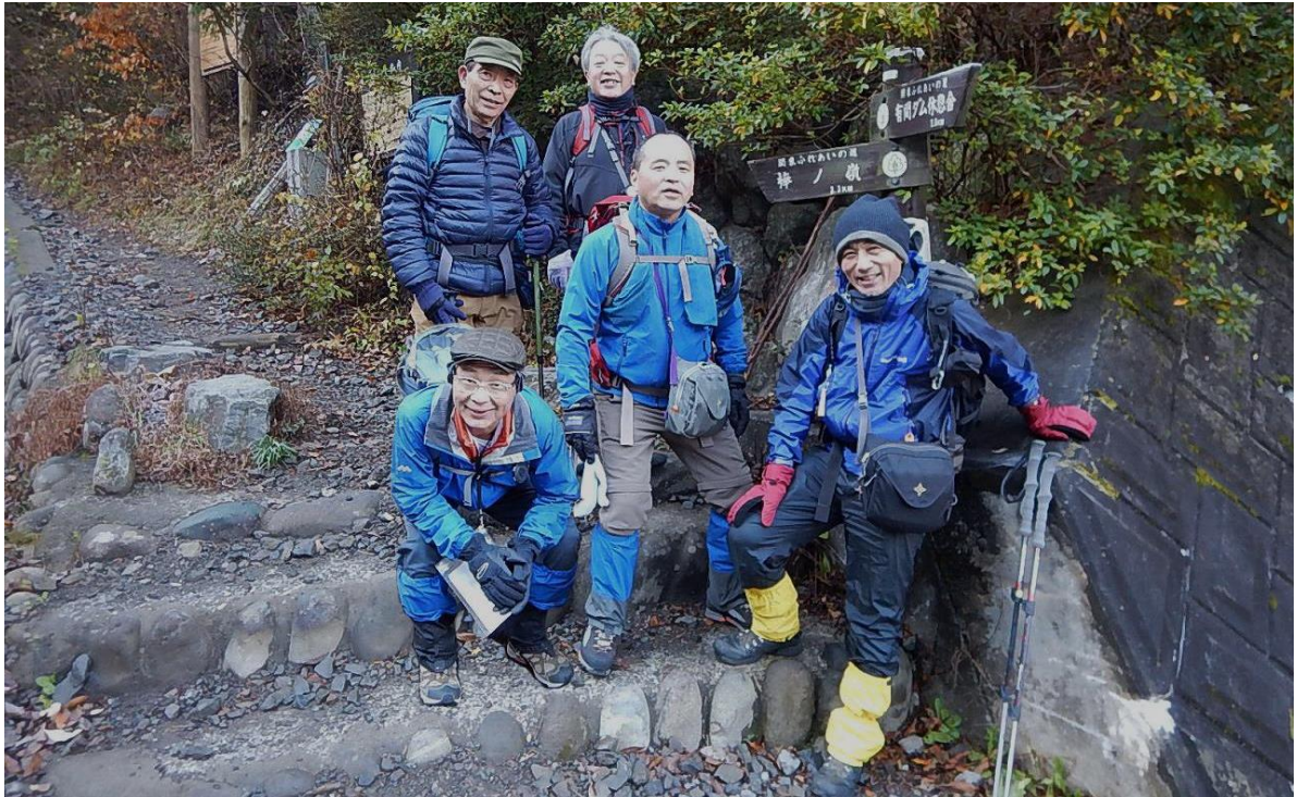
関東ふれあいの道(有間ダム～沢沿い、山沿い、岩茸石分岐)～棒ノ嶺