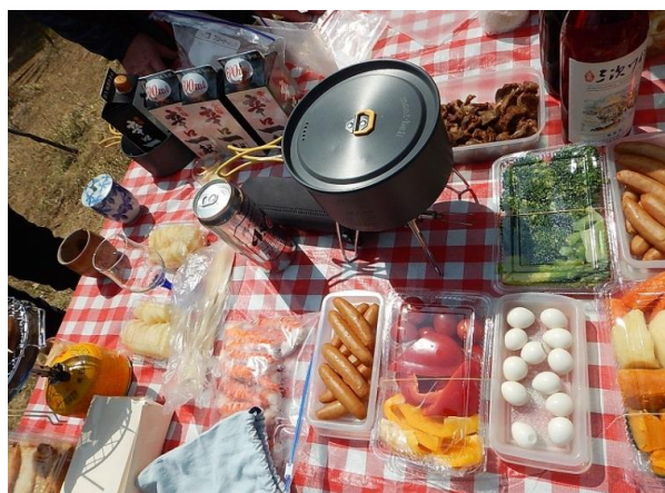
桑山さん次男夫婦も近くに花見