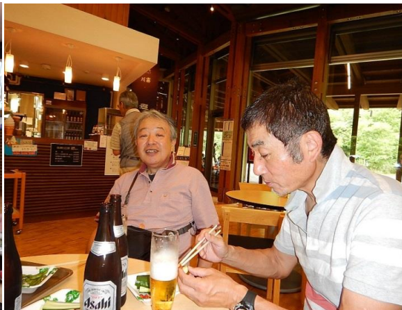
打ち上げは拝島ホルモンで重〜くいっぱい