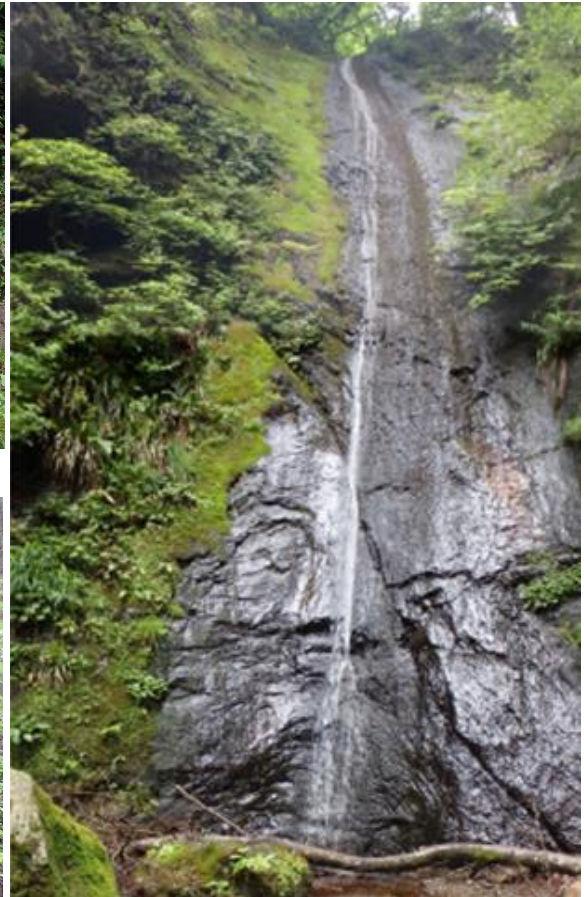
ロッククライミング楽しめるつづら岩