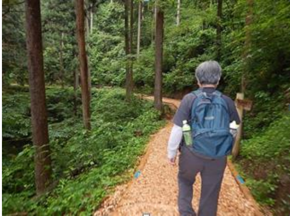
言う程に整備された遊歩道(出足まずまず)