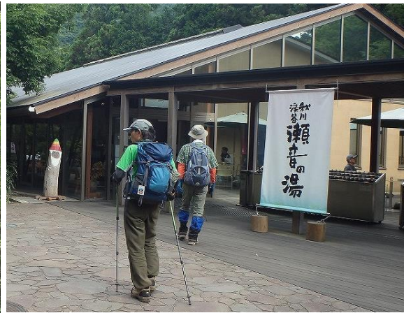
瀬音の湯レストランでラストランの軽〜くいっぱい