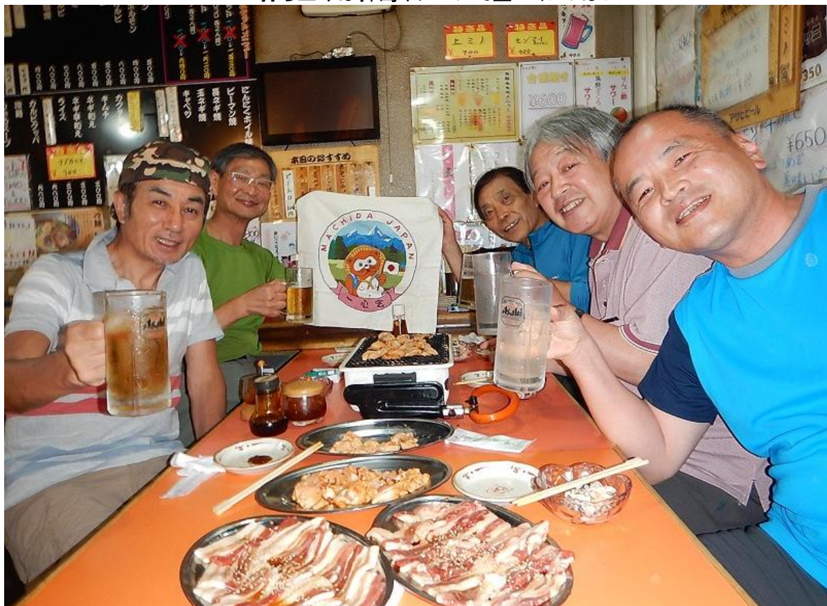
前回熊本『くまもん』の余韻さめやらず、『ホルモン』でのふれあい打ち上げ