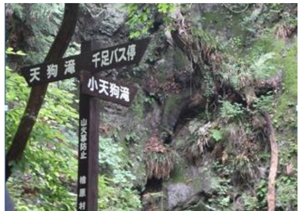
岩沿い、岩間を縫って進みます