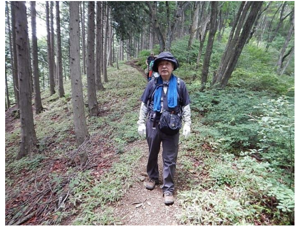
マツ カリトウゲ ツルアシヤマ 最高頂馬頭刈峠(940m)の手前、鶴脚山(914m)にて