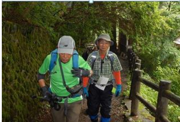
言う程に整備された遊歩道(出足まずまず)