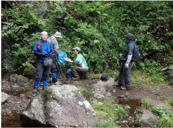
ここからつづら岩までの急登