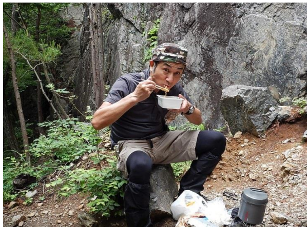
この一服がたまりません