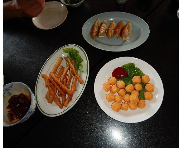
素晴らしい景観、疲れを癒す温泉、そして打ち上げ