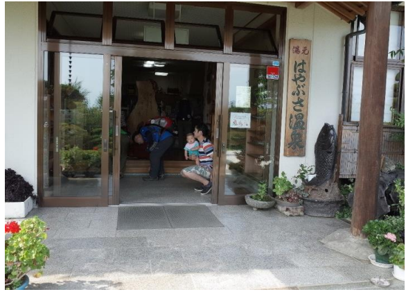
温泉に入りカジュアルに着替えてこれからアルコール会