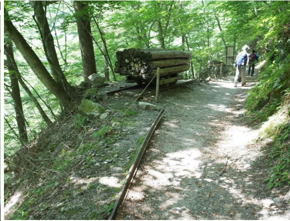
森林軌道の左は一步まちがえれば崖底真っ逆さま