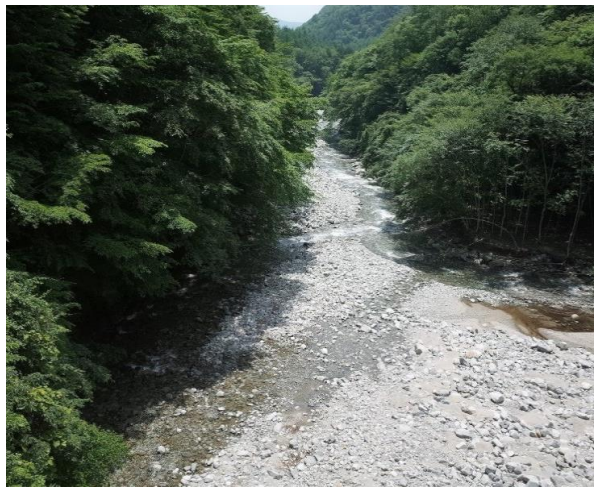
階段昇り、清流沿いの遊歩道に行く