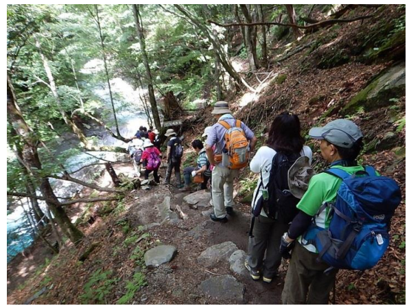
曲がりくねった長い長いロングロングワインディング溪流