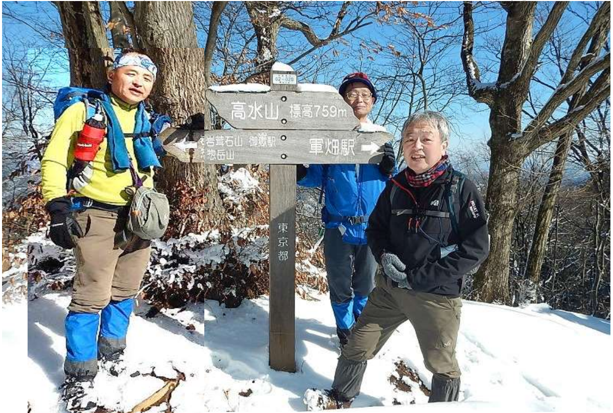
見晴しのいい尾根を登って岩茸石山へ 絶景かな雪渓かな.