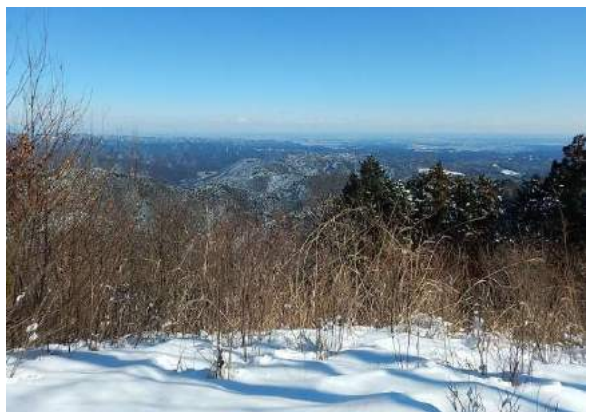
岩茸石山頂上(793m)本日の最高峰