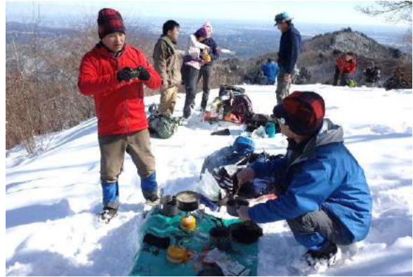
座って食べても立って食べても美味しい