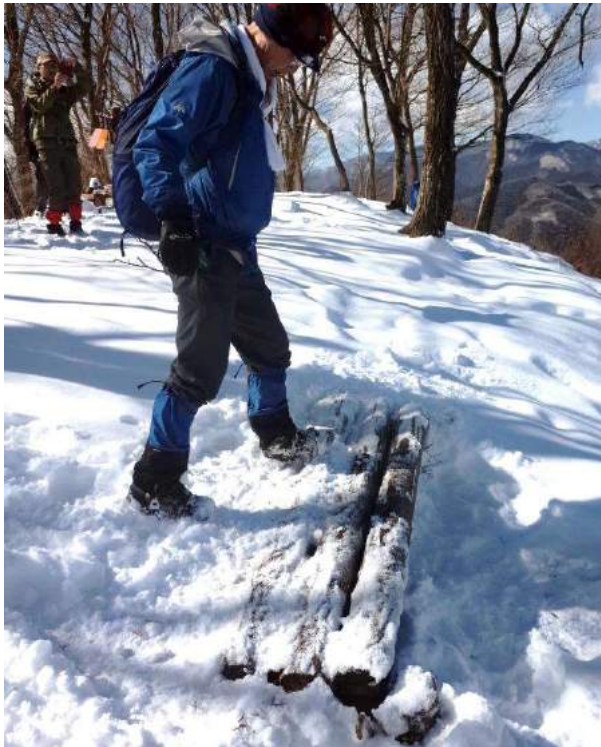
ランチテーブルの雪解けと掘り起し