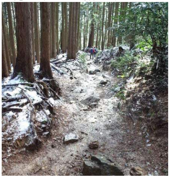
軍畑駅から御岳山方面の山肌の雪