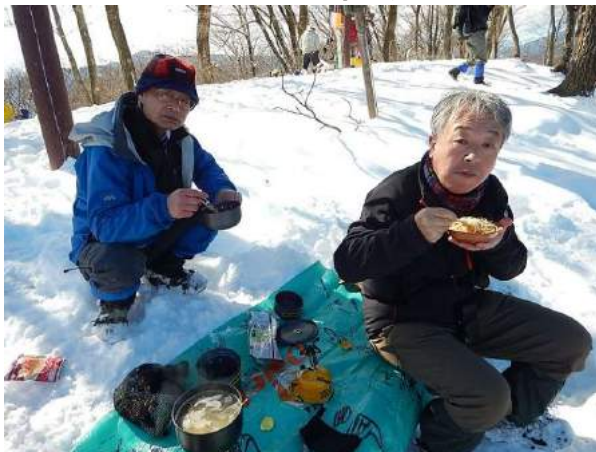
シートはDaieiフォークス