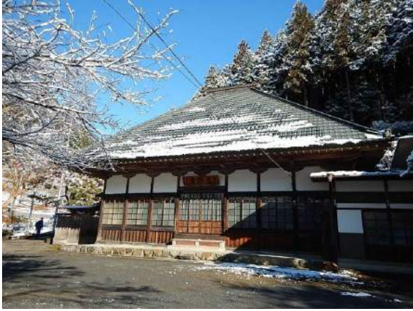
高源寺にばせお(芭蕉)の句碑あり