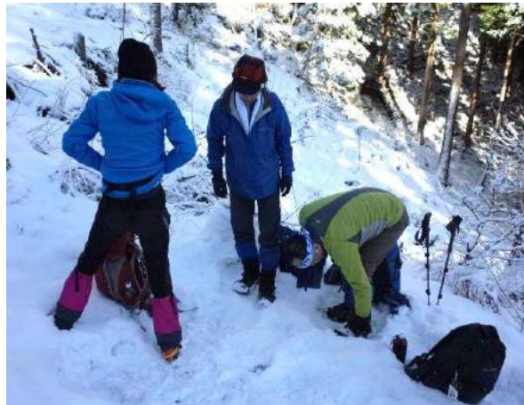
一瞬蕨山の恐怖がよみがえる