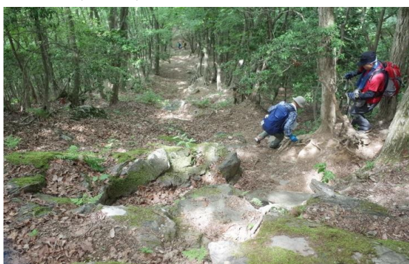
木々の間から、心地よい冷たい風 20℃