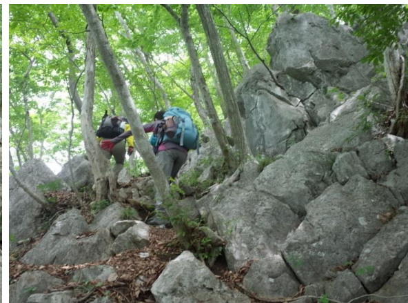
男坂を登ってごつごつ天狗岩頂上(800m)