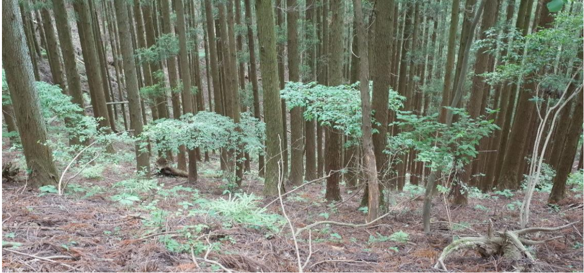
神社らしからぬ浅間神社にたどり着く