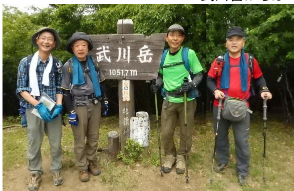
武川岳からは700mの下りに下り