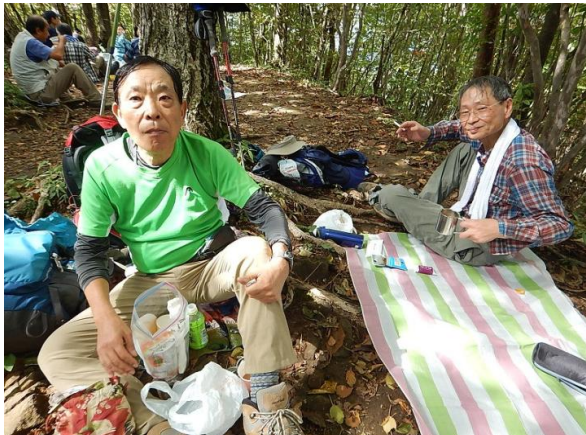
三頭山頂上でお弁当。おにぎり2つ