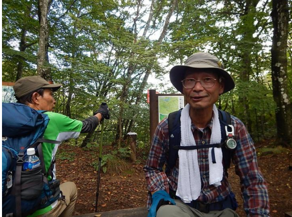
ムシカリ峠で一休み 頂上真近