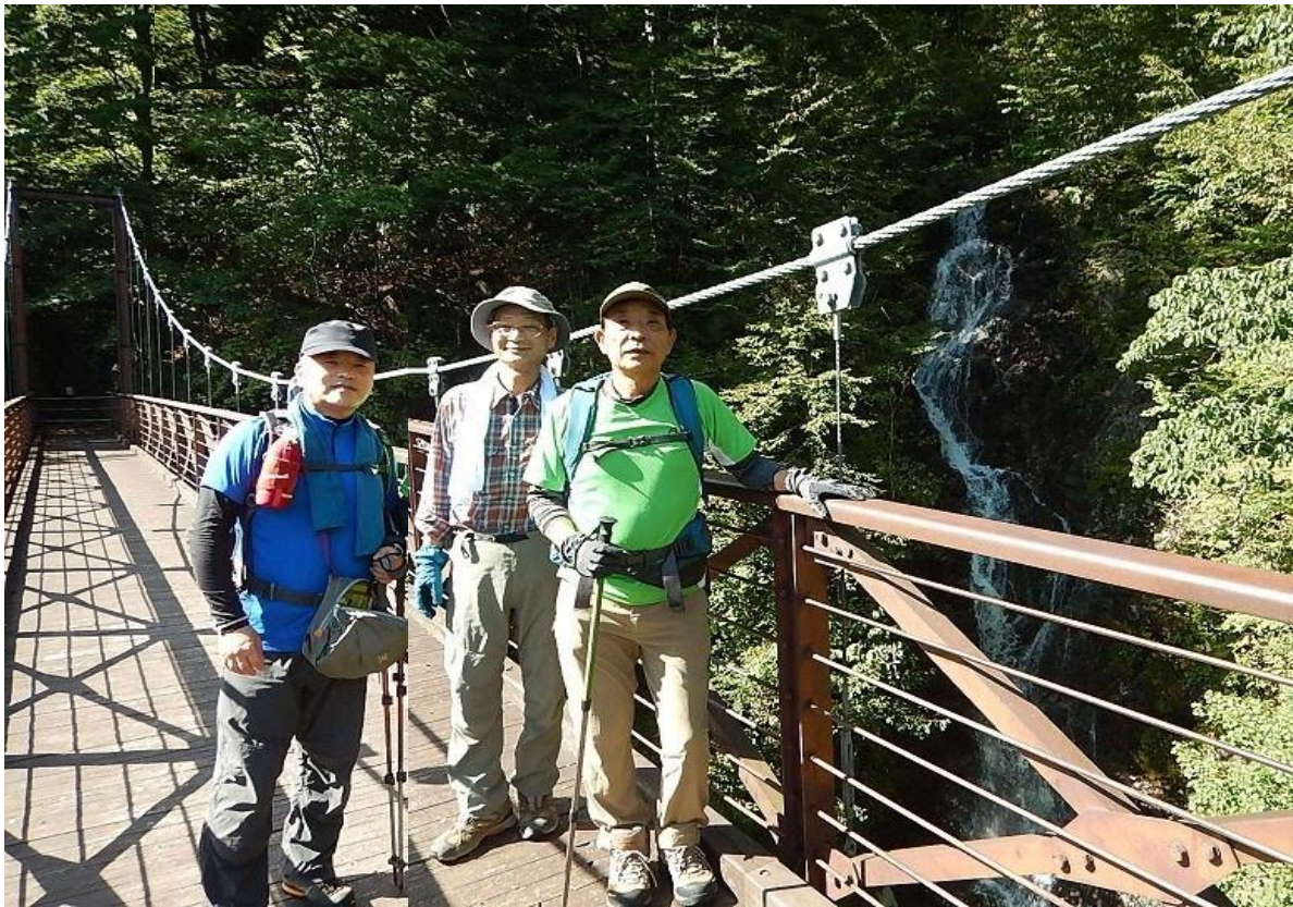
ここから本番、沢添いの登山道を標高差500m登ります