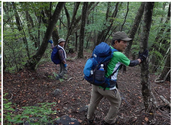
紅葉にはちょっと早い緑濃い林