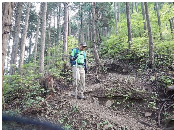
やっぱり急坂、膝はガクガク