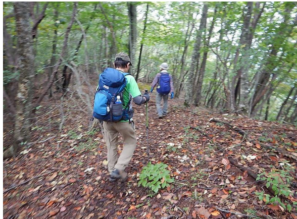
奥多摩湖目指し標高差1000mを下ります