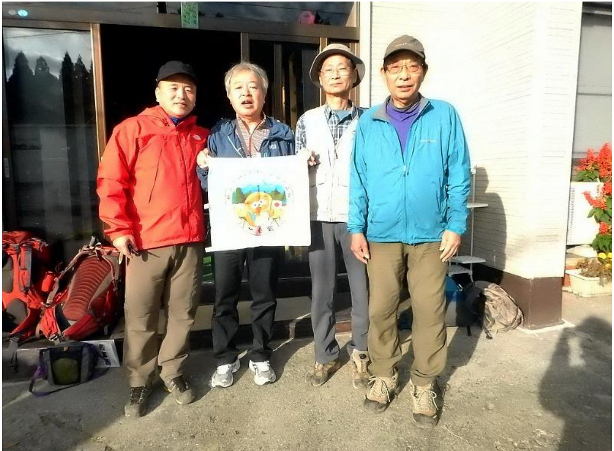
五色沼自然探勝路