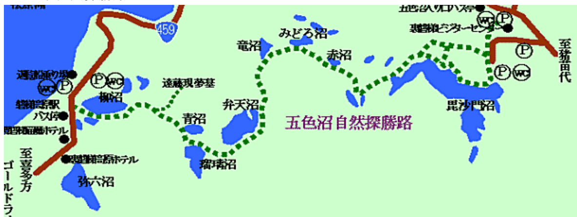
1日5食、ごしょくめまでなく、五色沼(ごしきぬま)