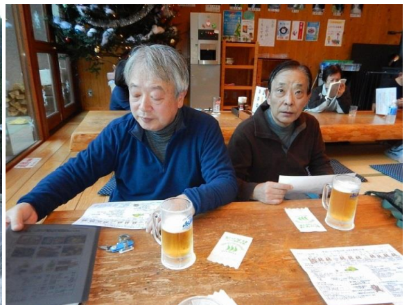
恒例の打ち上げ、一人顔がでかくて写真におさまらない