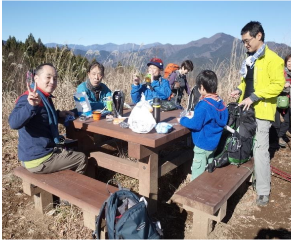
14時温泉のため、おむすび簡単ランチ