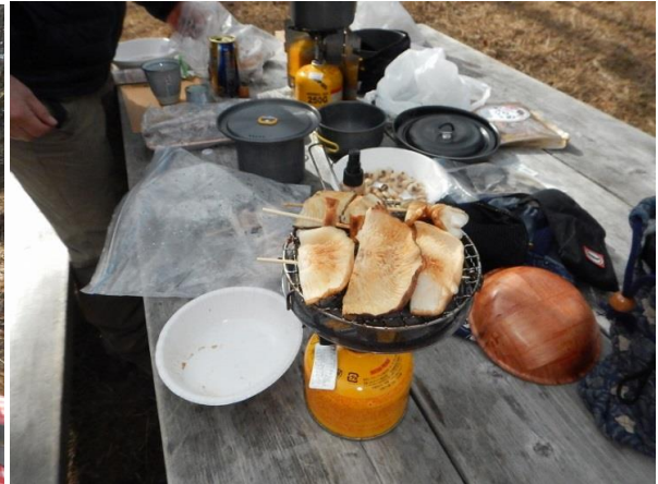
お酒の総量は二升とほどほどでした