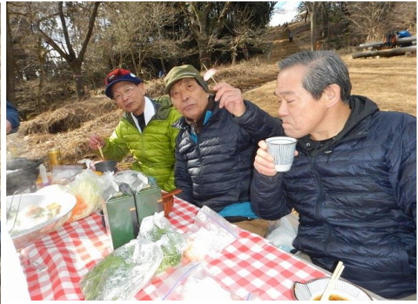
湯豆腐にしたづつみ、センス抜群の紫クローバーゼットに4月のフォンデュもどうぞ