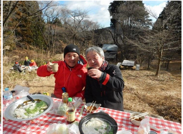
熱燗も次から次へ、焼き物しいたけ大人気