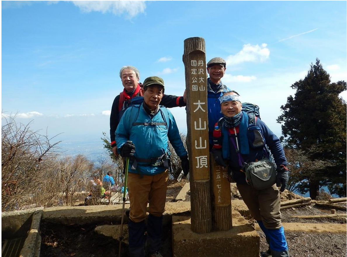
一日一善、一人一鍋