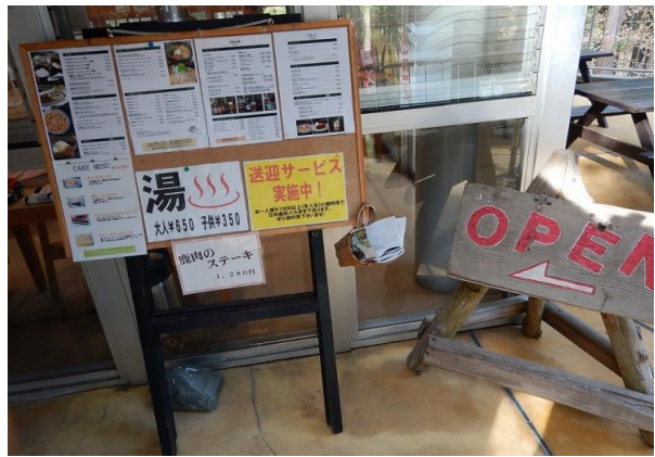
仕事でも、どこでも、ここでもくつろぎだけ