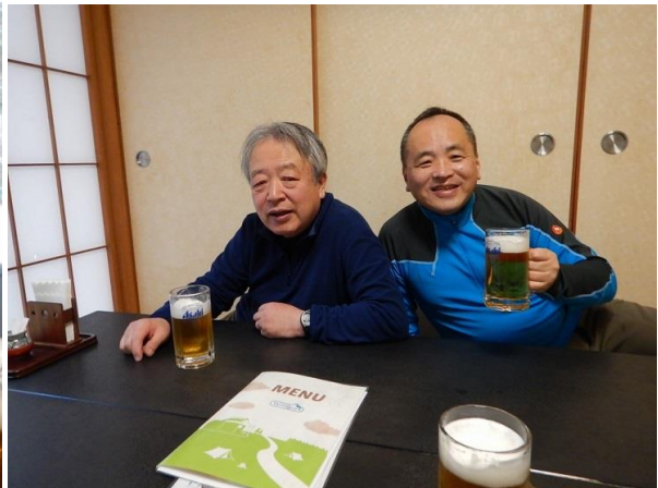
打ち上げはここ丹沢・大山を毎週パトロールされている山小屋のご主人の音頭で乾杯