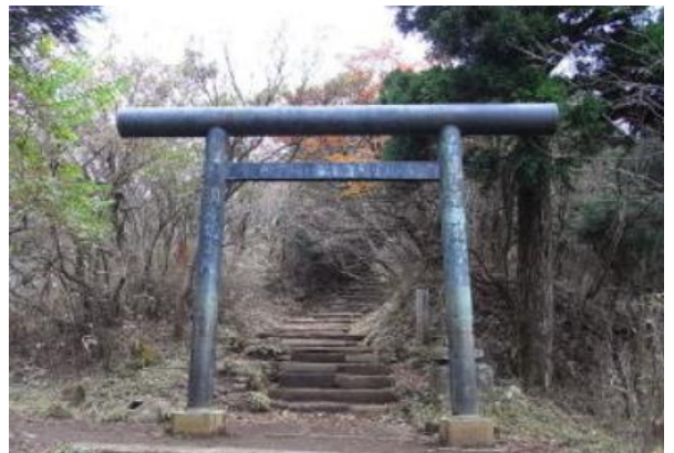
大山阿夫利神社摂社：奥社御祭神は大雷神