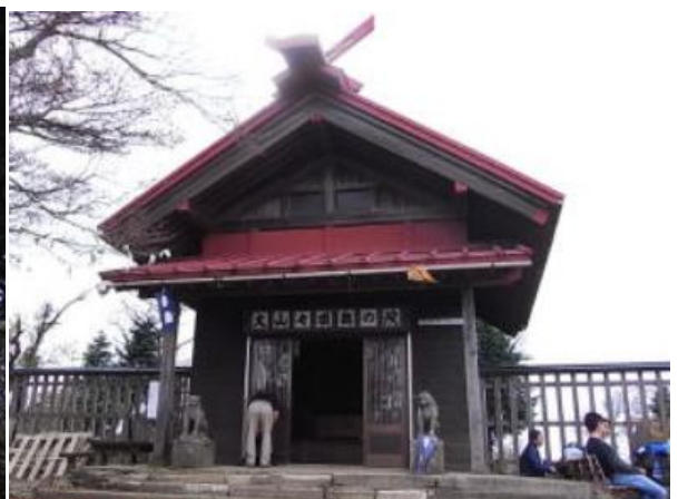
何とこの大山阿夫利神社摂社の隣がラーメン祭り会場に