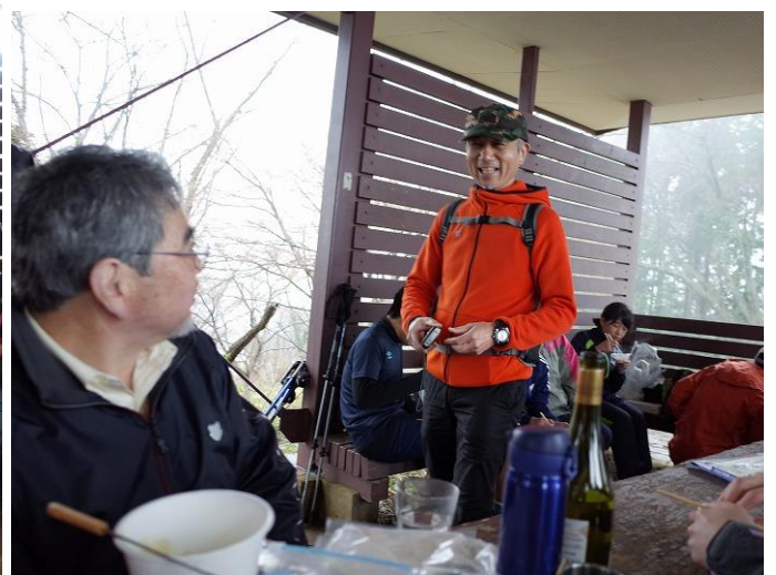
唯一の友達と会えて、感激もひとしお