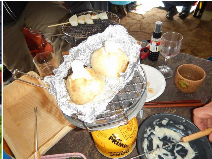
じゃがバターは初登場、大絶賛