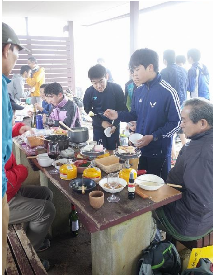
振り返ってびっくり、突然現る、謎の徘徊姉老人