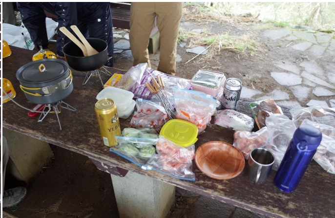
適時ではないにしても、適品・適量の食材