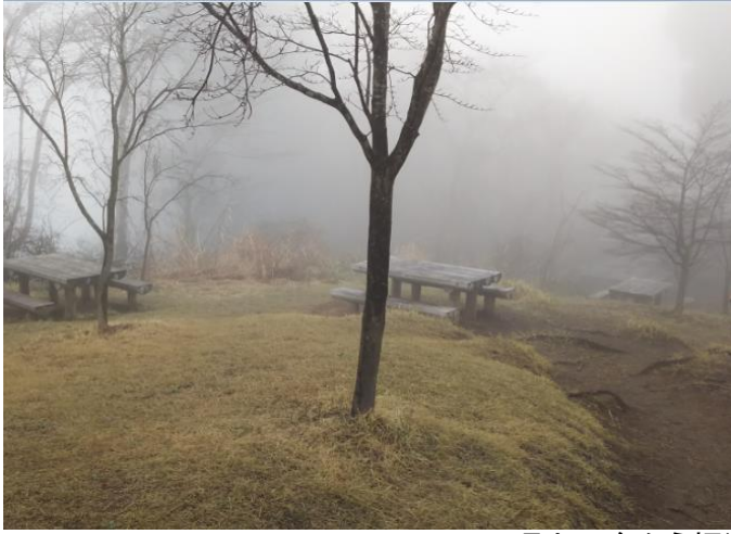
何と何と、一丁平はガスに霧雨