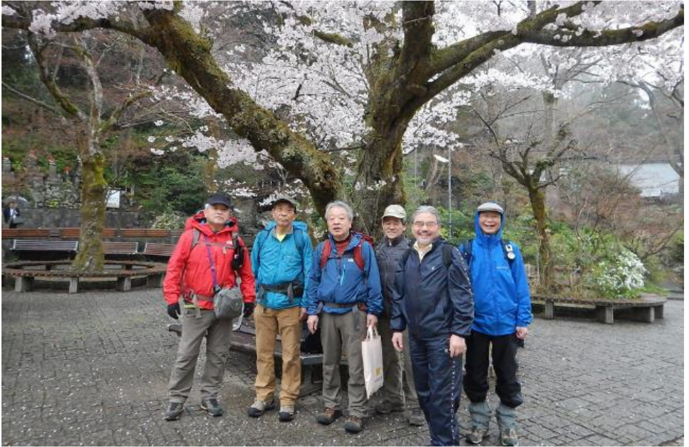
高尾山桜の名所はこちら