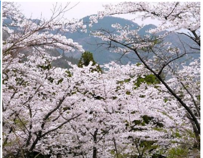
一丁平展望台からの眺めはこのようなです