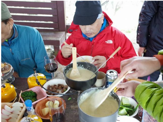
ホワイトソース、生クリーム、とろけるチーズかきまぜ