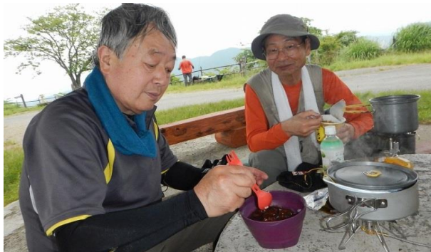
『美味しい』と聞かれ自分のが一番とおもっている