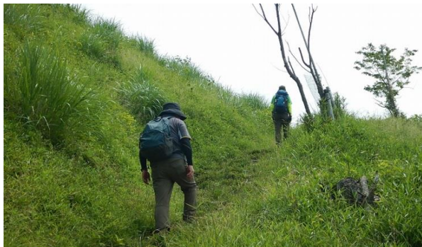
頂上らしからぬ平原頂上