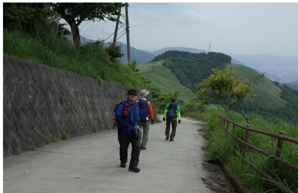
唯一の難所、そうなんしょ！