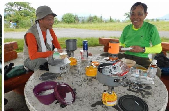
一人ひとバーナーの時代