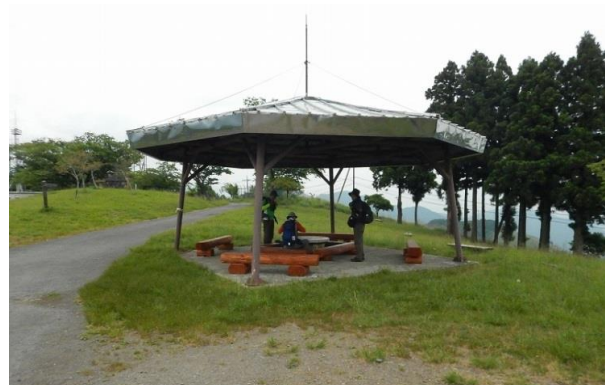
高尾山からこのあずまやのパターンが続く