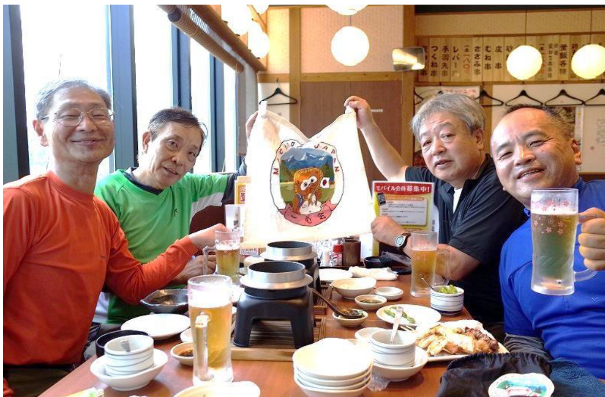
『やきとり道場:さくら』 アスティ三島サウス店(三島駅ビル内)