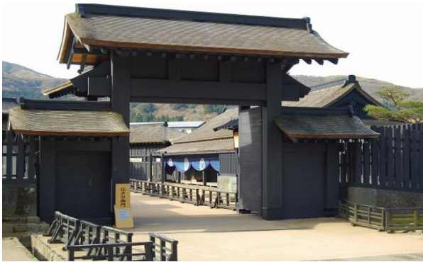
スタート地点の芦ノ湖カントリー入口着

小田原から芦ノ湖畔の箱根関所と駅伝ミュージアム、ここからさらに東海バスで襷をつなぐ