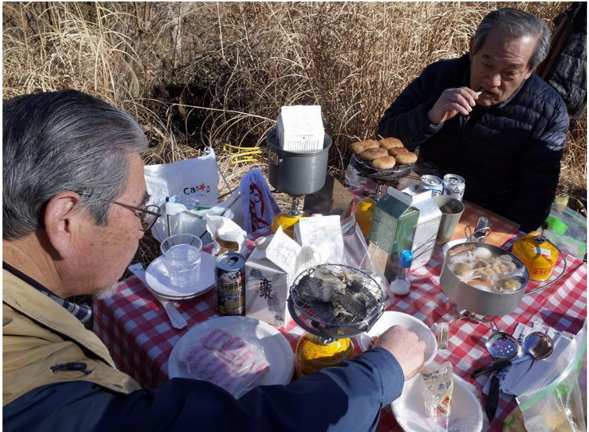
鍋オプションはウィンナー、スジ肉、もち入り油揚げ ハイハイ、お酒はぬるめ、ズボンはゆるめ