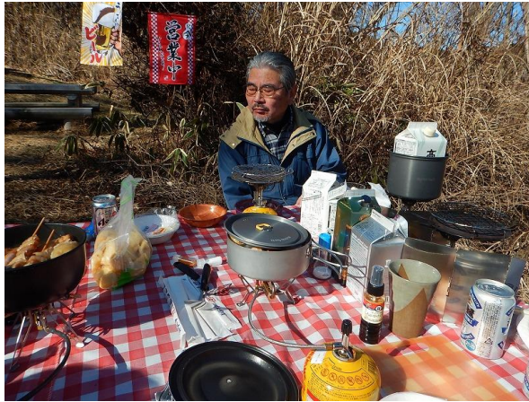
落ち着いた桑山観音様