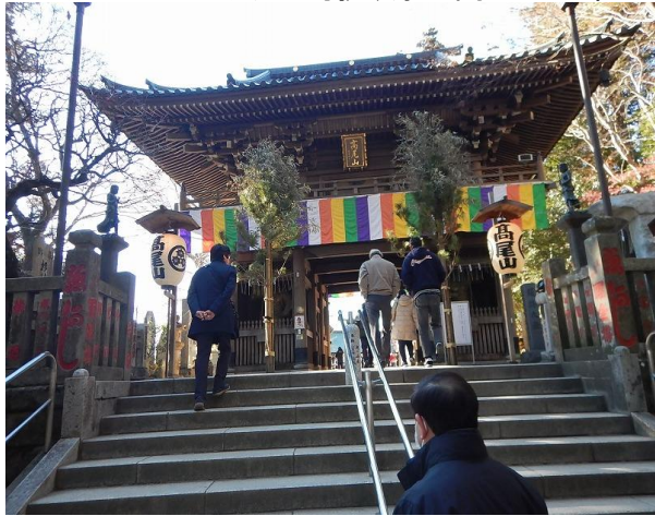
ギンガムチェックに対抗、浄心門の垂れ幕