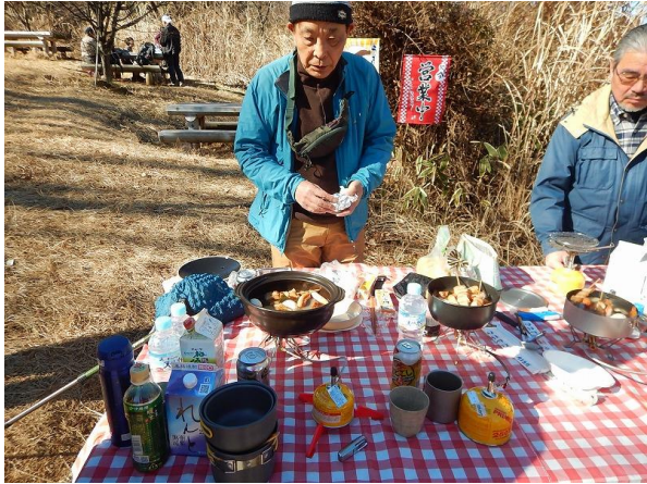
浄心門の垂れ幕も黙るギンガムチェック