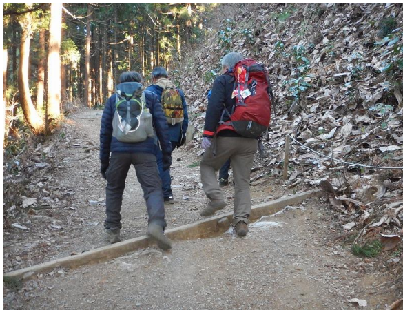
この段差を乗り越えればもう安心