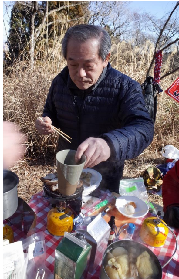
ぬるめなので椀を網焼きで熱く新技術