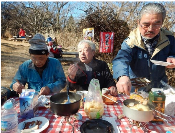
ちょっとすじ肉いただき