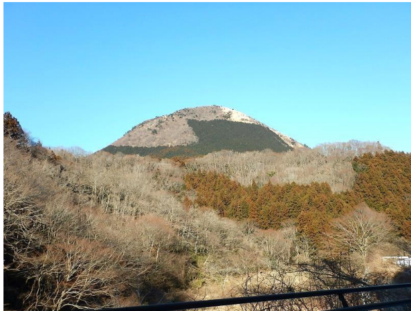
ふりかえれば矢倉岳