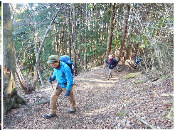
標高500mから残雪あり、温度も下がり、空気も元々ない存在もさらに薄くなります