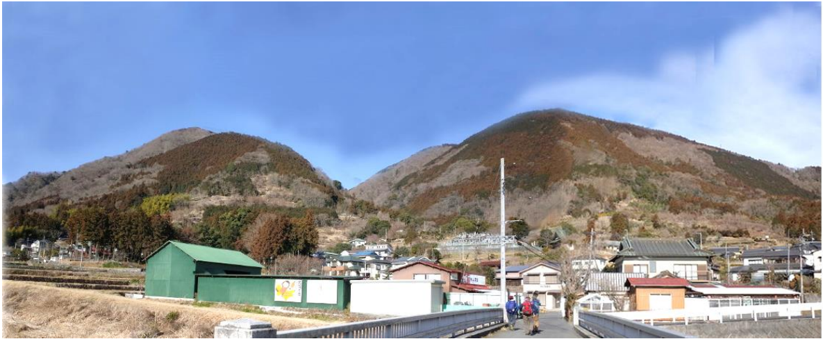
駅はあっち矢倉岳はこっち標高200m地点から登ります。