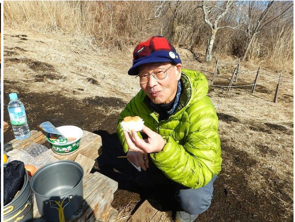
塩むすびに味噌、醤油かけてキツネ色