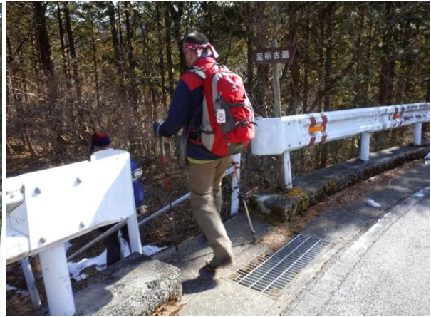
右上の道が足柄古道の終点