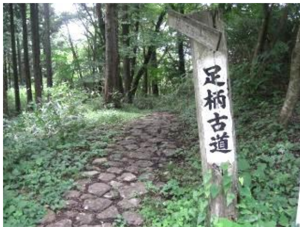
車道の脇道を上がる