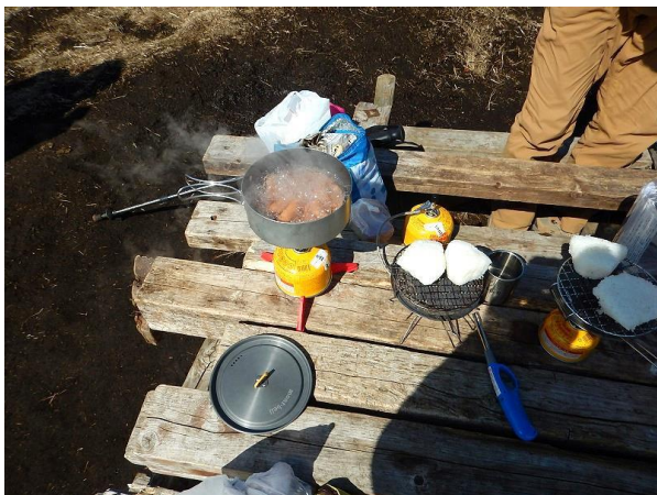
カップ麺湯にウィンナー茹でる