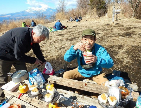
焼きおにぎりとカップ麺はランチのヨロ綱ヨロピック