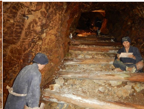
最も坑内に強く心に響き渡ったのは工夫のつぶやき