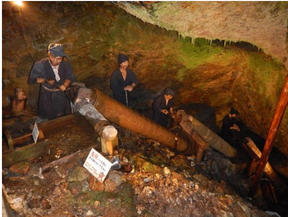
木杵を支柱にして崩落防止