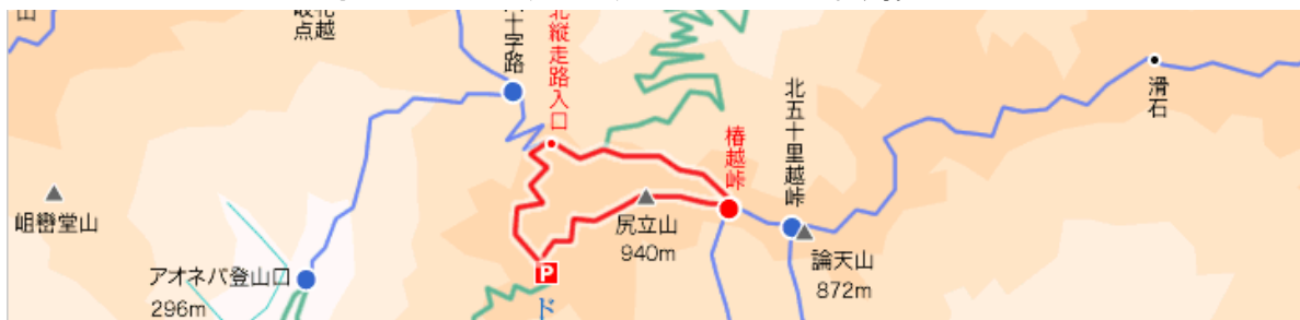
アオネバ(青粘)登山口からアオネバ十字路へ あ〜お〜ねばあと〜うお〜といい