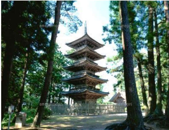
妙宣寺の五重塔(国の重要文化財)