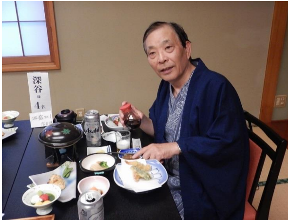
敷島荘のパンフと同じ夕食