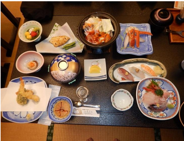
おかず10品の海の幸山の幸