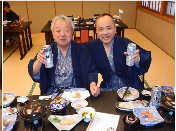
両たぬきの乾杯腹つつみ