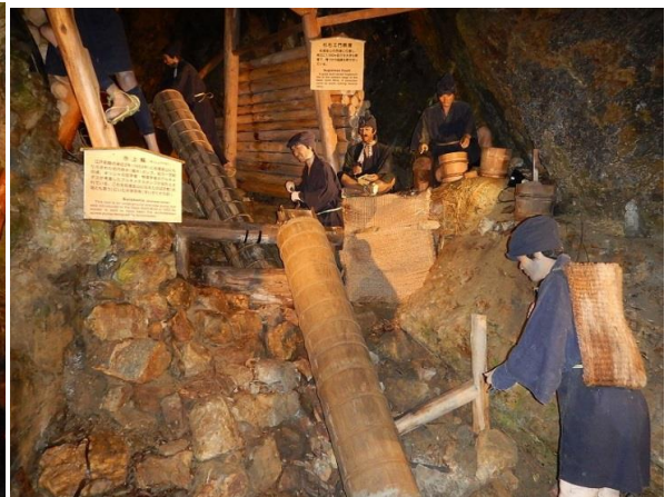
不正な持ち出し防止の見張り役