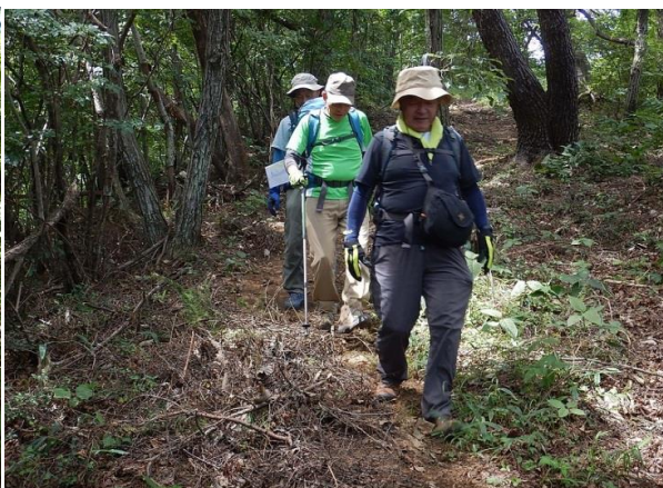
人が通らない落ち葉いっぱい姉道