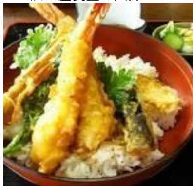
浜田屋食堂の天井