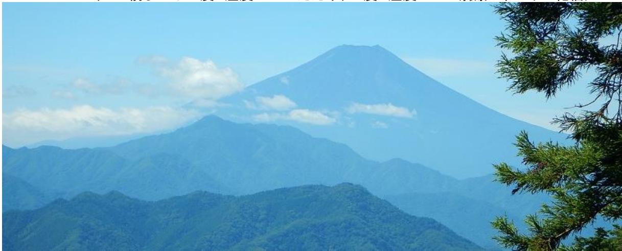
その秀麗富嶽十二景:富士をバックに半ズボン1名

2、3日前までは36度. 湿度60%→ただ今、22度. 湿度40%