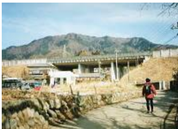
中央自動車道を超えれば鳥沢駅