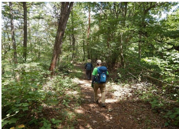
帰りの道も誰もいない広い雑木姉林を抜けて