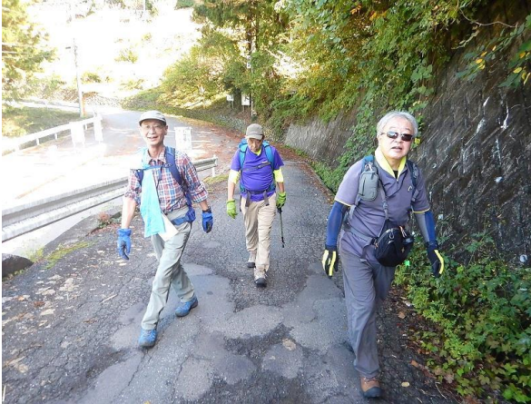
青空(ブルー)車道の脇道から②登山道に入る