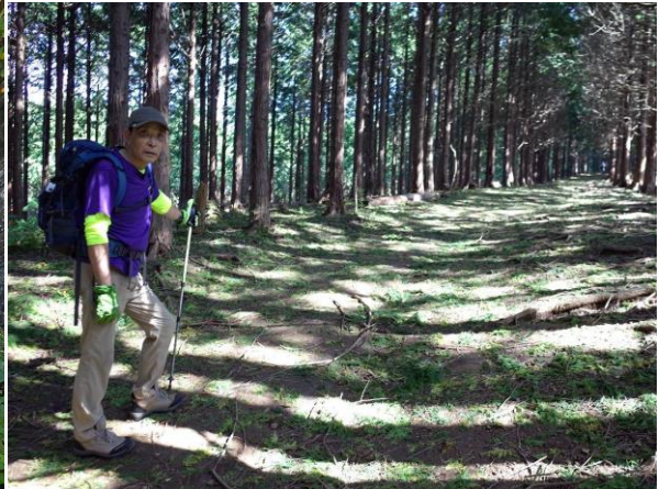
森と泉に囲まれた広い登山道