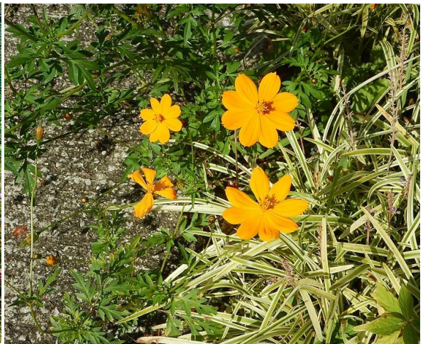
芦ヶ久保駅隣接の道の駅『きのこ茶屋』にて