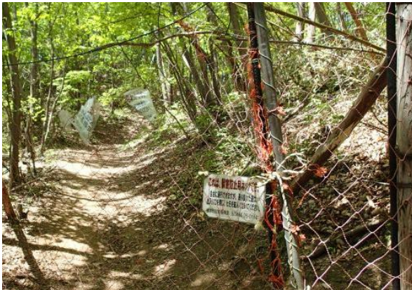
シカ、イノシシの侵入防止ネット