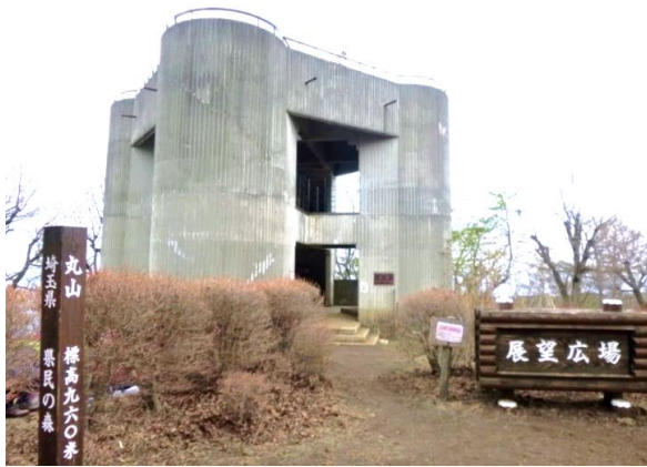
展望台らしからぬ展望台