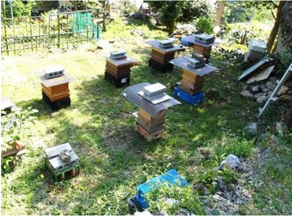
花の町らしくミツバチの楽園