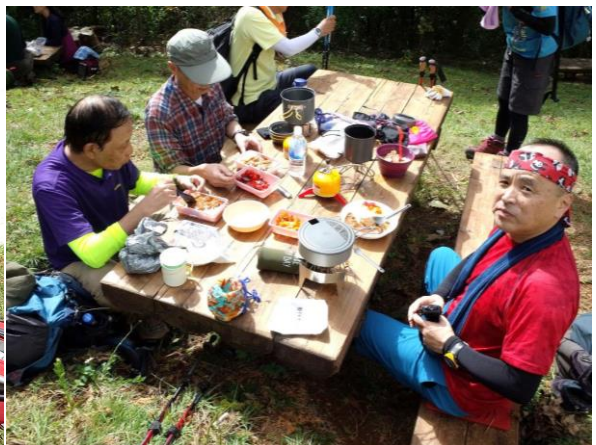
小錦も驚きの能登錦米、ごはん粒がそそり立ちカレーとあいまって金色に輝く