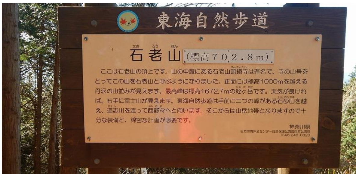
急坂もすぐにゆるやかな尾根道に、ゆるめゆるめね