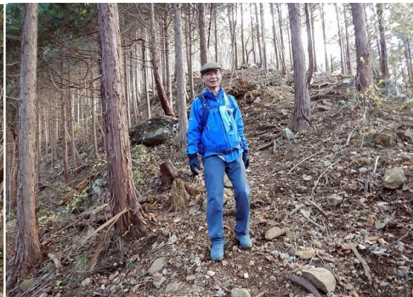
倒木が道を塞ぐ、またいで越える唐変木