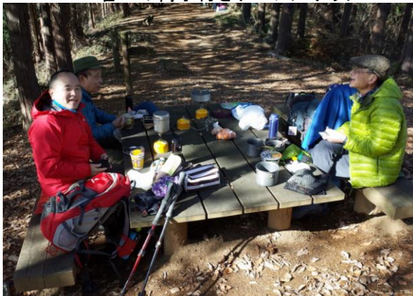
熱湯にウインナ茹でて、明太子パスタ