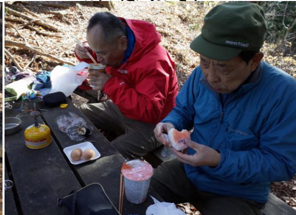
朝電車乗り遅れのショックはみじんもなし