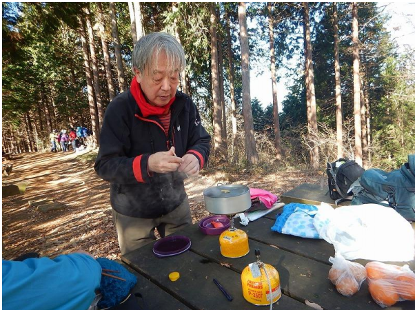
熱湯にウインナ茹でて、明太子パスタ