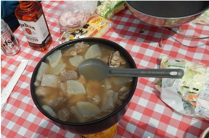
ぎゅうすじ煮込みとは究極の極み