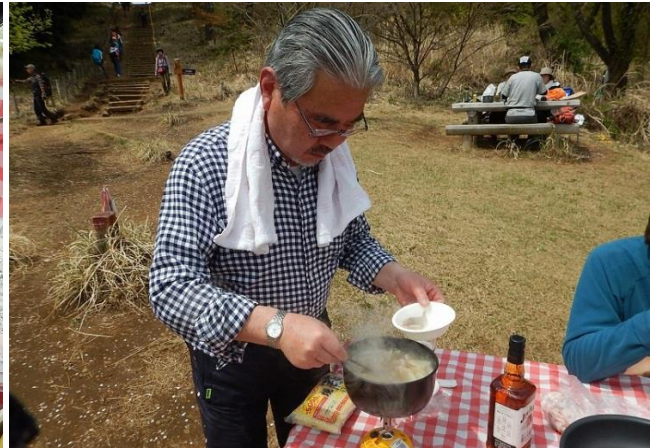
桑山特選を皆さんに振る舞い