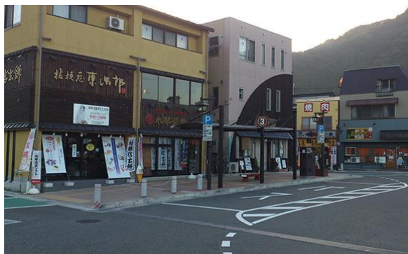
岩殿山は武田氏の重臣小山田氏の山域にあった、この人は体が重いだけの重臣である