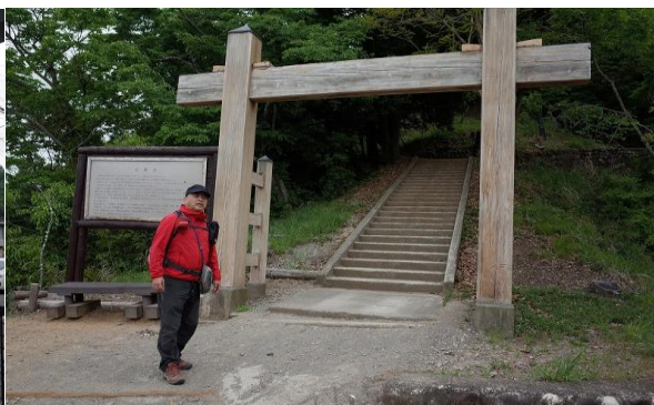
今はこんなところにぽつんと一軒家、昔はこんなところにお城・・・難攻不落のお城