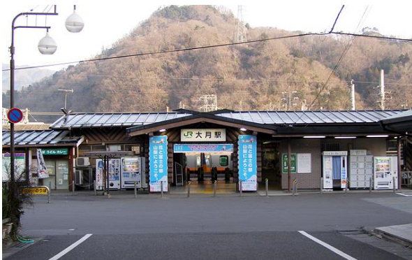
レトロな大月駅舎と駅前食堂街、にぎやかさでたい平：秩父の勝ち