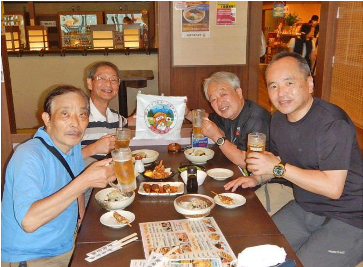
3蜜もソーシャルディスタンスもこの場では封印