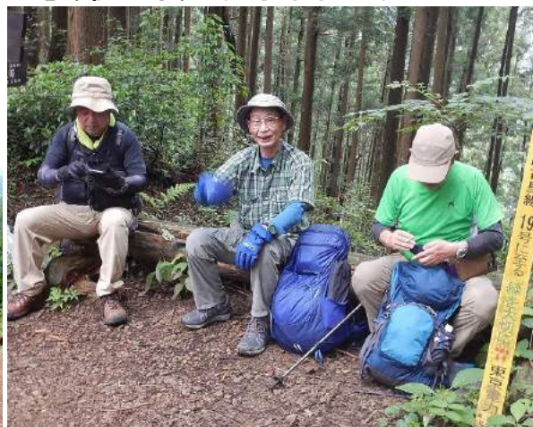
ランチも休憩もソーシャルディスタンスを保ちます