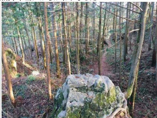
見晴らしが唯一ここだけ、コロナ感染拡大対策の同方向向きのランチ