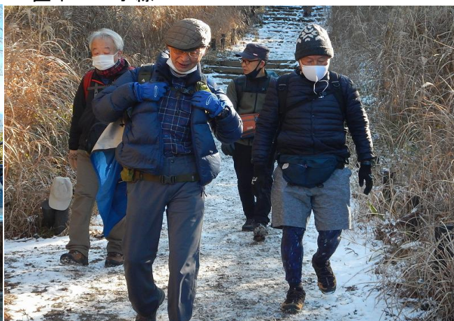
メルセデスベンチテーブルは雪除がされ、この人たちは厄除けがされました、