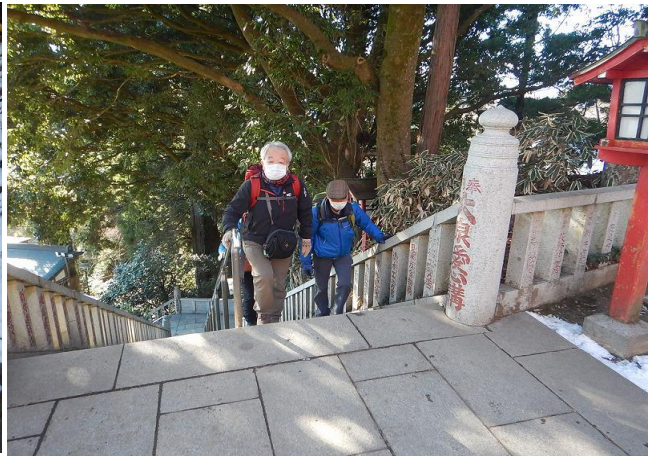
薬王院大師様から『開運はこの人の厄除から始めよ』