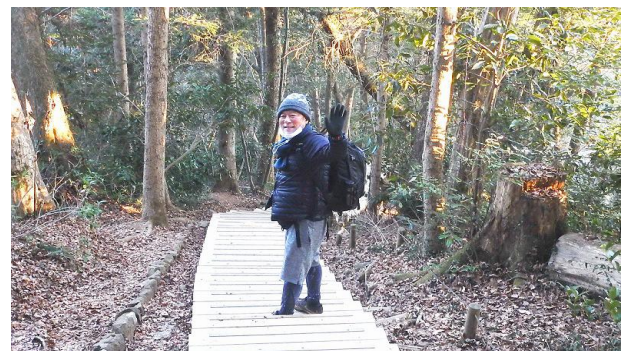
この後のご想像におまかせ