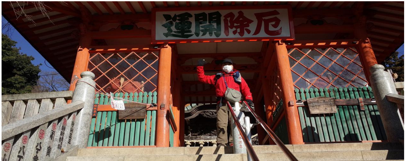
『お許し下さい、一根不浄』と詫びてます