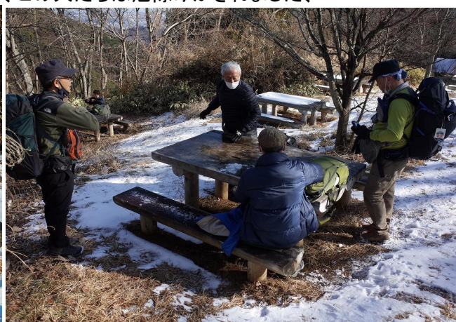
いつものように、敷かれたシートには、黒い縁取りがありましたアサヒジョッキ缶で乾杯となりました