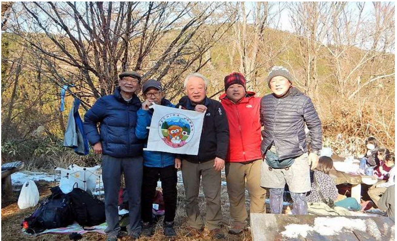
帰路はリニューアルされた六号路