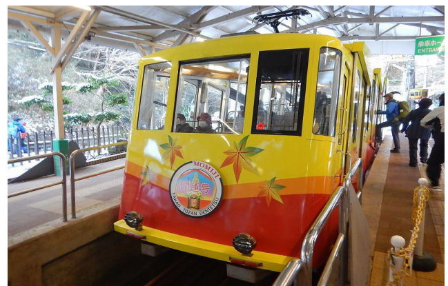
六根清浄、一根不浄