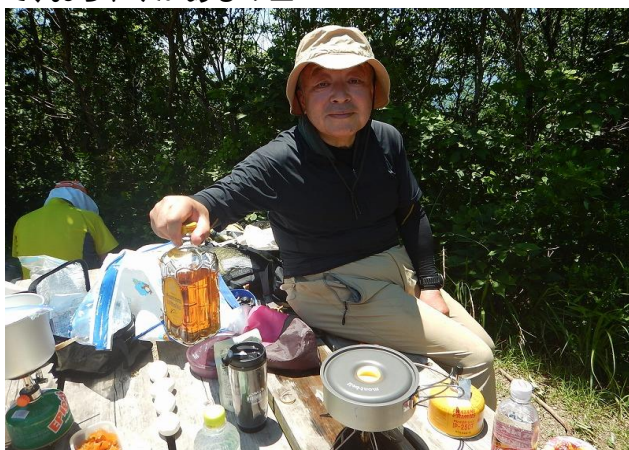
カレーとごはん温めます