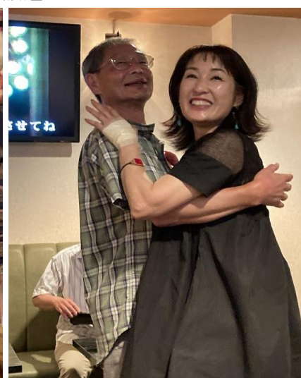
ここは国分寺のとあるスナック、ミラーボールがまわりジュリアナの良き日を思い出します