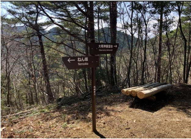
大明神展望台の標識あり