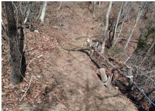
この急登が終わることなく続きます