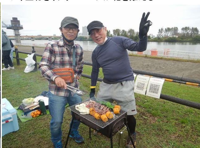
肉は神戸牛厚切り、野菜はこれがベスト品種、アルミ箔じゃがいもは炭火の横