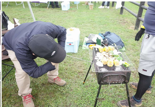
和牛ステーキを赤ワインで、ピーマン、玉ねぎ、トウモロコシが花を添える