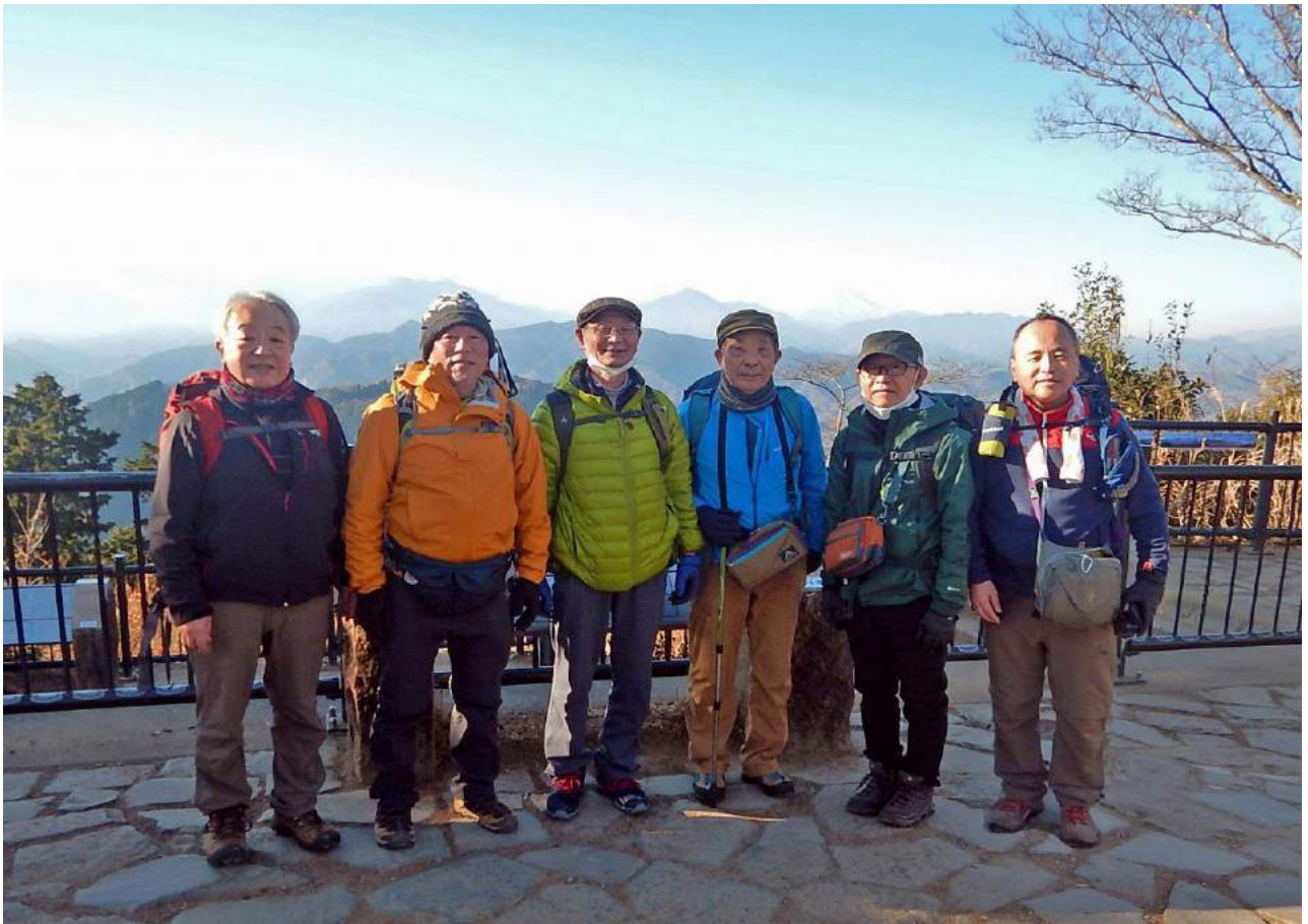
頂上広場は予想よりも人少なし→一丁平にてちゃんこ祭りを始めます