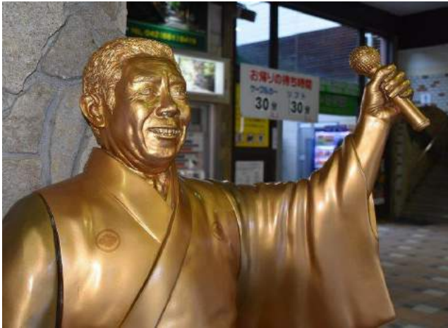
高尾山口駅の北島三郎像の鼻の穴