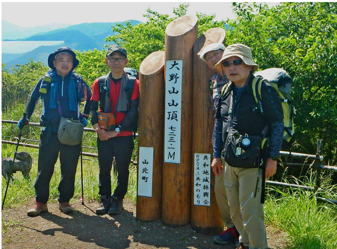
これぞ大野山の『頂上とあずまや』ビューポイント