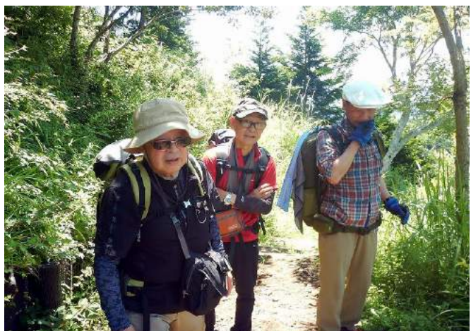
富士見ながらの大野山、梅雨の合間の絶好の晴れ日