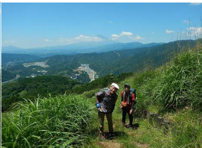
上りは左に河口湖と富士