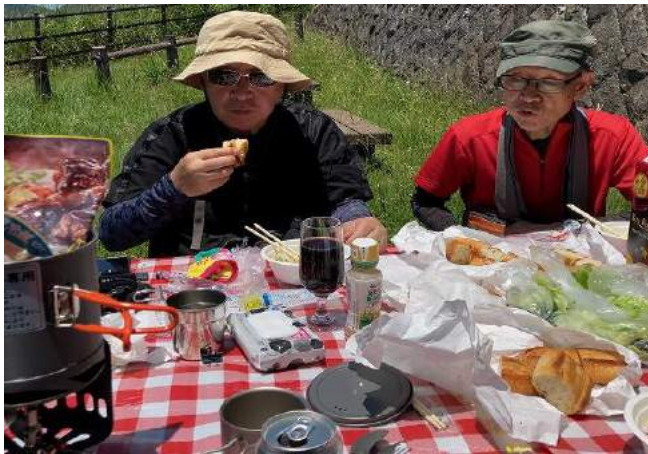
ギンガムチェックのシートが映えます