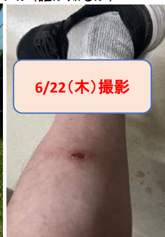
JR山北駅近くのさくらの湯でヒルの治癒かねて汗と血を流す