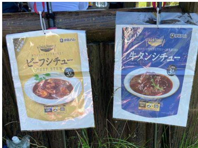
各自金のシチューを堪能、正月の一丁平の再現