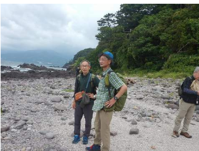
三石海岸をバックにチョット気取り気味の『一心会軍団』