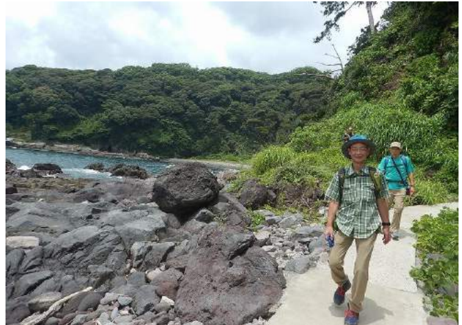
猛暑とはいえ、強い風が熱さを和らげてくれる