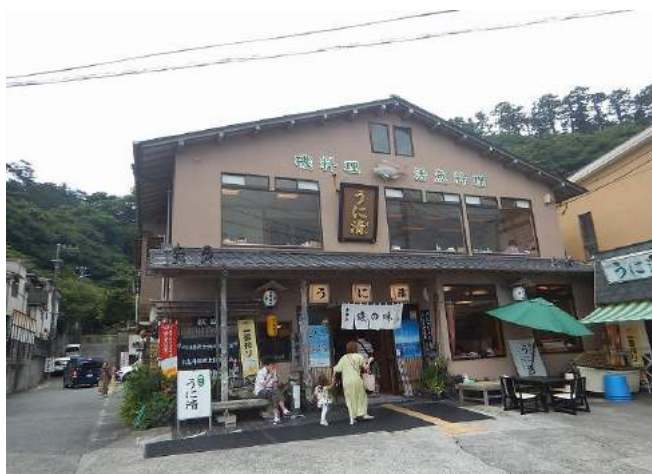
お決まりの生に続いて、サザエのつぼ焼き、カマス、伊勢えび