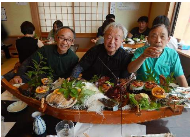
ごはんにかニ汁、たくあん漬物でしめとなりました